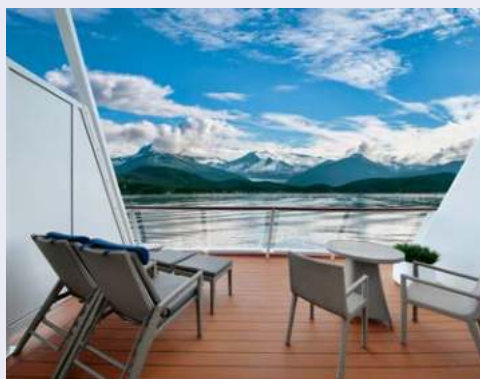
Herrliche Aussicht vom Balkon aus (Beispiel)

Reisedokumente: Deutsche Staatsangehörige benötigen einen 6 Monate über das Reiseende hinaus gültigen Reisepass. Zudem ist zur visumfreien Einreise in die USA (gegen Gebühr) und Australien eine Online-Registrierung vor Reiseantritt notwendig. Weitere Hinweise erhalten Sie bei Buchung. Sollten Sie einer anderen Staatsbürgerschaft angehören, weisen Sie uns bitte darauf hin. Wir beraten Sie gern. Bitte beachten Sie: Staatsangehörige und Doppelstaatler von Irak, Iran, Syrien oder Sudan oder Reisende, die sich nach dem 01.03.2011 in/im Irak, Iran, Syrien, Nordkorea, Sudan, Jemen, Libyen oder Somalia aufgehalten