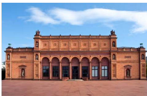
Blick auf die Kunsthalle Hamburg

Hier werden Sie um 11.00 Uhr in einem alten Speicher erwartet. Im einzigartigen Kaffeemuseum der Familie Burg begeben Sie sich auf die Spur des beliebtesten Getränkes der Deutschen – vom Anbau in aller Welt, über das hanseatische Handelskontor bis hin zum Ladengeschäft aus Omas Zeiten. Erfahren Sie, wie viel Handarbeit im Anbau, der Ernte und der Weiterverarbeitung der begehrten Bohnen steckt.