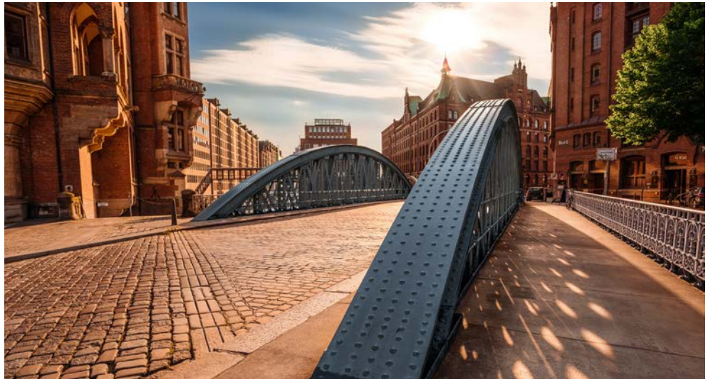
In der Hamburger Speicherstadt

Beginnen Sie das neue Jahr mit einer Reise nach Hamburg und erleben Sie gleich zwei Highlights. Sie besuchen das Konzert der beiden sympathischen Starpianisten Lucas und Arthur Jussen im Großen Saal der Elbphilharmonie und die große Caspar–David–Friedrich–Jubiläumsausstellung anlässlich des 250. Geburtstages des Romantik–Malers. Das ikonische Konzerthaus, das 2022 seinen 5. Geburtstag feierte, ist das neue Wahrzeichen Hamburgs und der kulturelle Stern am hansestädtischen Kulturhimmel. Unumwunden ist es ein besonderer Moment, wenn die ersten Takte, Rhythmen und Akkorde von der Mitte der Bühne aus ihren klangvollen Weg durch die wie ein Weinberg angelegten Zuschauerreihen finden und dem großen Konzertsaal musikalisches Leben einhauchen. Dazu erwartet Sie ein abwechslungsreiches winterliches Rahmenprogramm, denn "Das Tor zur Welt" ist zu jeder Jahreszeit eine Reise wert.