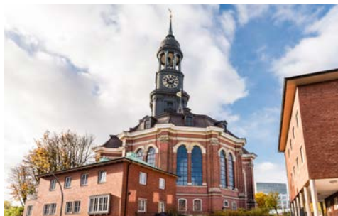
Hauptkirche Sankt Michaelis – liebevoll Michel genannt

Um 16.45 Uhr werden Sie wieder abgeholt, erhalten auf dem Weg Richtung Speicherstadt bereits viele Informationen zur Elbphilharmonie und mit Blick auf