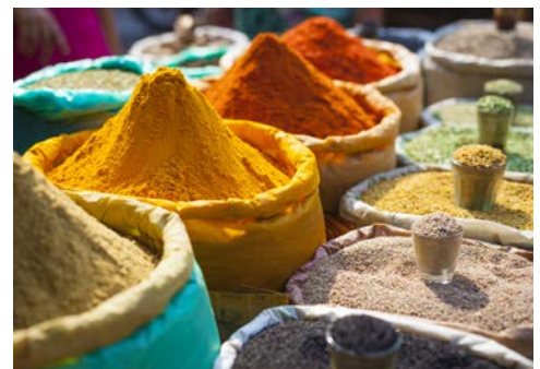
Finden Sie Inspiration auf den Souks

Heute heißt es Abschied nehmen. Transfer zum Flughafen und Rückflug nach Deutschland. (F)