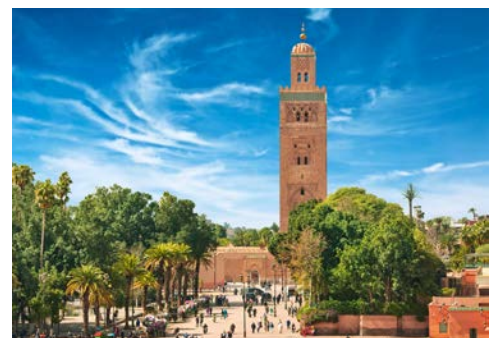
Marrakesch, Koutoubia Moschee