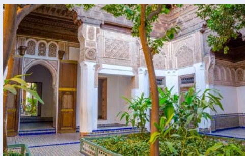
Bahia-Palast in Marrakesch

Marrakesch ist bekannt als „Perle des Südens“ und liegt im Südwesten Marokkos. Sie ist eine der vier Königsstädte des Landes, die zu einem bestimmten Zeitpunkt in der Geschichte Marokkos Hauptstadt einer der großen Dynastien (Idrisiden, Almoraviden, Almohaden, Meriniden, Saadier und Alawiden) und entsprechend mit herrschaftlichem Prunk gesegnet waren. Die Altstadt Marrakeschs wurde bereits 1985 zum UNESCO-Weltkulturerbe erklärt. Zunächst besuchen Sie den Bahia-Palast, wo noch heute die Blütezeit der marokkanischen Oberschicht lebendig wird. Im Jahr 1867 erbaut, finden Besucher auf rund 8.000 qm verteilt 160 Räume, Patios und Riads. Weit geöffnete Flügeltüren geben den Blick auf den wunderschön angelegten Innengarten mit Skulpturen und Brunnen frei. Die Luft ist erfüllt von Jasmin-Duft. Die Koutoubia Moschee aus dem 12. Jh. mit ihrem hoch aufragenden Minarett bestaunen Sie von außen. Begeben Sie sich danach in die Landeshauptstadt und Königsresidenz Rabat, ebenfalls UNESCO Weltkulturerbe. Rabats eigentliche Geschichte beginnt im 10. Jh. mit der Errichtung einer Klosterburg, an der Stelle der heutigen Kasbah. Freuen Sie sich auf einen Besuch und schlendern Sie durch den wunderschönen Andalusischen Garten und die verwinkelten Gassen. Genießen Sie hier eine individuelle Mittagspause und etwa Freizeit. (F/A)