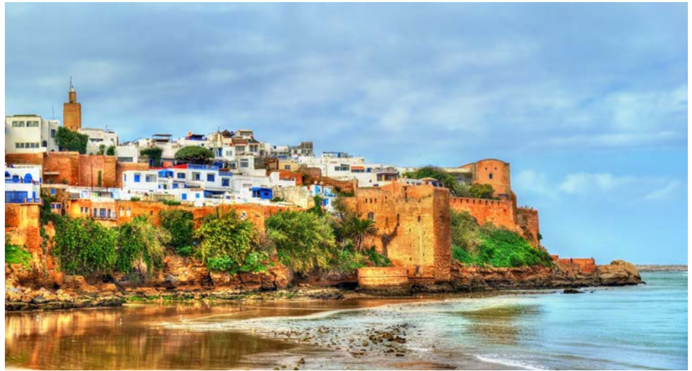
Blick auf Rabat

Am Vormittag setzen Sie Ihren Stadtrundgang in Rabat, der jüngsten Königsstadt, fort. Sie besuchen das prunkvolle Mausoleum Mohammeds V. mit dem