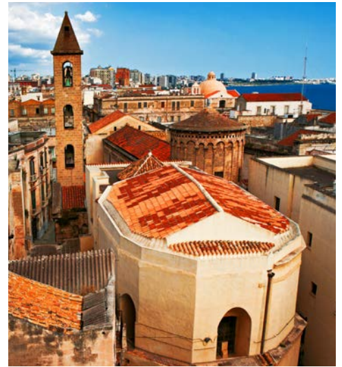
Altstadt von Neapel

sich ein Panoramablick auf die traumhafte Bucht, während die anschließend besuchte Kathedrale von Sorrent durch die Architektur in Form eines lateinischen Kreuzes beeindruckt. Die Kathedrale wurde zwar bereits im 11. Jahrhundert errichtet, aber im 15. Jahrhundert im Stil der Romanik sowie der Renaissance komplett erneuert. Sie besitzt eine Kanzel mit eleganten Marmorsäulen und -platten, in deren Mitte sich ein Flachrelief der Taufe Christi befindet. Sehenswert sind hier auch die prächtige Orgel aus dem Jahr 1897 und das geschnitzte Chorgestühl aus kaukasischem Nussbaumholz mit seinen Heiligendarstellungen. Im Anschluss an die Stadterkundung geht es per Bus weiter ins Hinterland. Dort lernen Sie einen typischen Agriturismus, einen Bauernhof, kennen. Hier erfahren Sie, wie Öl und Limoncello produziert werden, und eine Bäuerin erklärt, wie leckerer Mozzarella hergestellt wird. Bei einem kleinen Imbiss gibt es zudem Köstlichkeiten aus der Eigenproduktion zu probieren. Lassen Sie sich den herzhaften Käse, Salami, Oliven, eingelegte Auberginen und den hausgemachten Mozzarella schmecken! Weißwein, Wasser und eine Kostprobe des Limoncellolikörs gehören ebenso zum leiblichen Wohl.