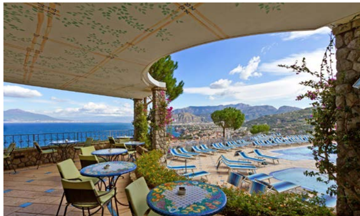
Traumhafter Ausblick von der Poolbar