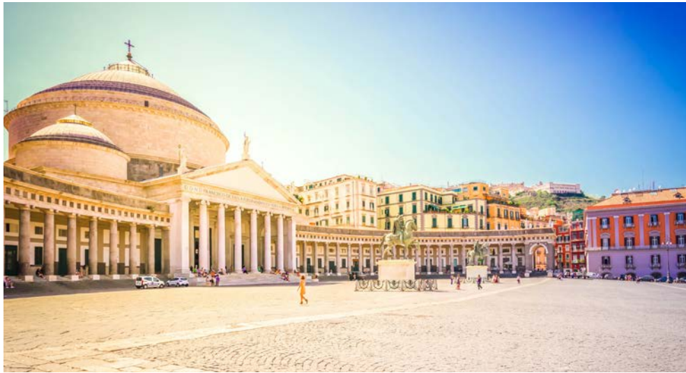
Neapel – Piazza Plebiscito