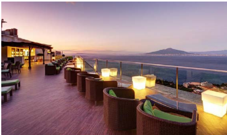
Herrlicher Ausblick von der Dachterrasse