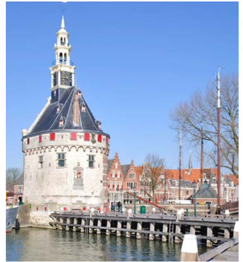
Willkommen in Hoorn