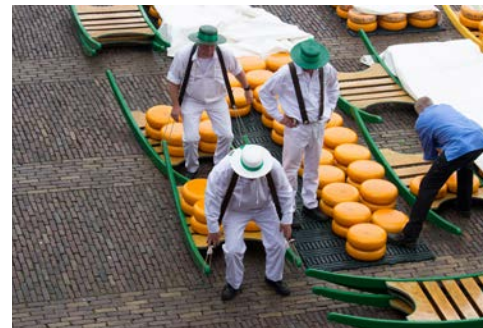
Auf dem Käsemarkt in Alkmaar

Die erste Tour führt Sie durch kleine Dörfer und das wunderschöne flache und grüne Polderland. Der erste Haltepunkt ist das Freilichtmuseum „Zaanse Schans“ (freier Eintritt), ein altes, traditionelles Dorf mit uralten Holzhäusern, einer Käserei, einem traditionellen Holzschuhmacher und verschiedenen Windmühlen. Nach dem Besuch des Museums radeln Sie weiter durch das Land von Leegwater, ein grünes, trockengelegtes Naturgebiet zwischen Amsterdam, Alkmaar und Hoorn. Besuchen Sie das ehemalige Walfischfängerdorf De Rijp und die Museumsmühle Schemerhorn. In Alkmaar erwartet Sie das Schiff in der Nähe der historischen Altstadt.