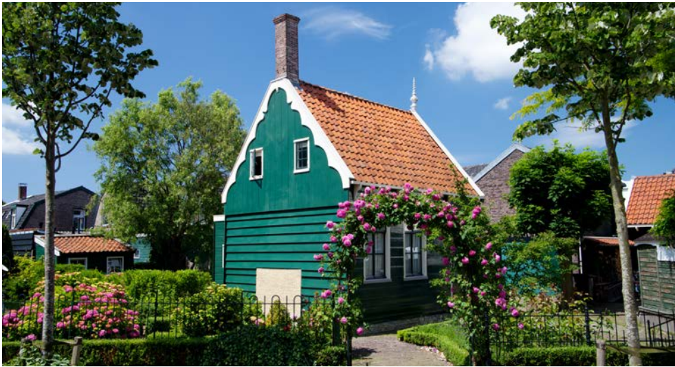
Museumsdorf Zaanse Schans