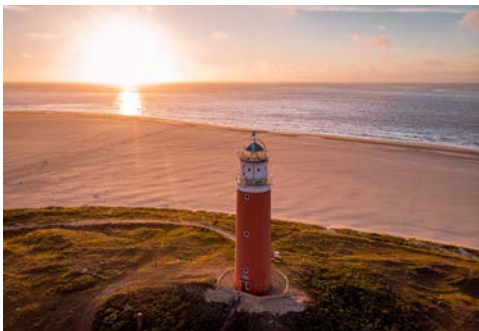
Traumstrand auf Texel

und traumhafte Naturschutzgebiete. Legen Sie am Nordseestrand eine Pause und evtl. eine kleine Bade- runde ein oder besuchen Sie die Seehundeauffang- station Ecomare. Am späten Nachmittag fahren Sie mit der Fähre zurück nach Den Helder.