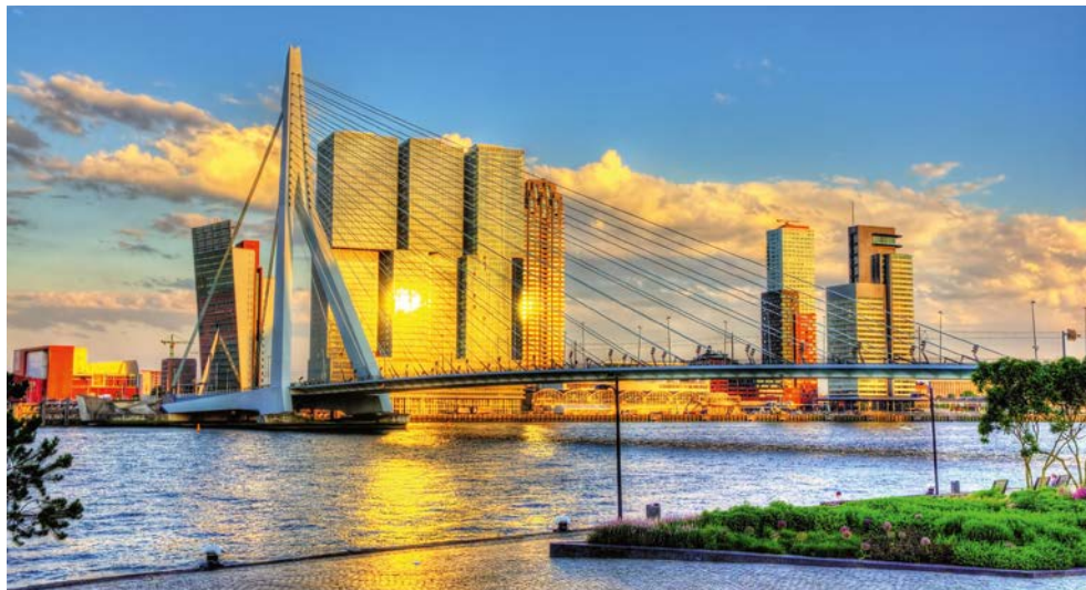
Rotterdam mit der Erasmusbrücke

*Abhängig von der behördlichen Vergabe der Liegeplätze kann auch Vianen als Alternative für Schoonhoven angelaufen werden. Fahrplan dann am 5. Tag Utrecht – Vianen, Radtour ca. 48 – 69 km und am 6. Tag: Vianen – Gouda – Rotterdam, Radtour, ca. 59 km. Endgültige Vergabe der Liegeplätze im Frühjahr 2026.