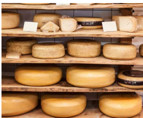
Käse aus Gouda – ein Genuss!

Zwei Radtouren stehen zur Wahl: die kürzere Variante führt nach Delft – hier haben Sie die Möglichkeit, die Porzellanmanufaktur zu besuchen. Für die längere fahren Sie direkt in den Regierungssitz der