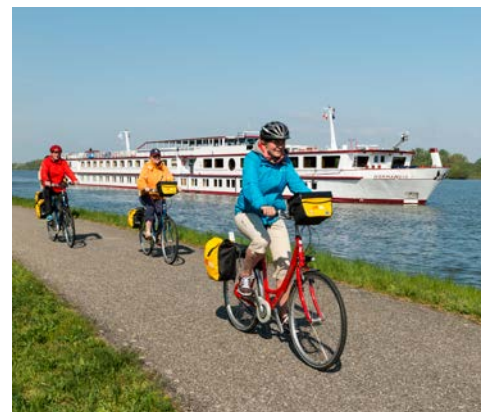
Freuen Sie sich auf die schönen Radtouren

Heute erwartet Sie eine sehr abwechslungsreiche und interessante Tour. Von Gorinchem radeln Sie über Leerdam – bekannt durch den Leerdamer Käse – in die Festungsstadt Vianen. Hier sollten Sie eine kurze Pause in einem der zahlreichen Straßencafés einlegen. Mit der Fähre setzen Sie über den Lek und radeln weiter nach Vreeswijk mit seinen engen Gassen. Weiter geht es über die kleine Stadt Nieuwegein – vielleicht statten Sie dem Fort Jutphaas, das versteckt in einer grünen Oase in Nieuwegein gelegen ist, noch einen kurzen Besuch ab, bevor Sie Utrecht erreichen. Utrecht gilt als das Herz Hollands. Die Stadt wurde rund um den Dom herum erbaut. Damit ist es praktisch unmöglich, sich in der verkehrsberuhigten Innenstadt mit den idyllischen Grachten zu verlaufen.