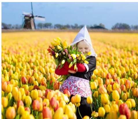
Ab März beginnt die Tulpenblüte!

Nach dem Frühstück Ausschiffung und Rückreise wie gebucht.