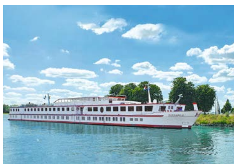
Die NORMANDIE begleitet Sie