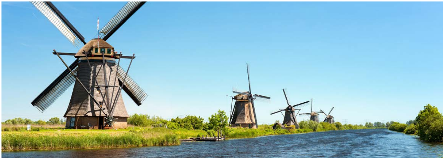
Die berühmten Windmühlen von Kinderdijk