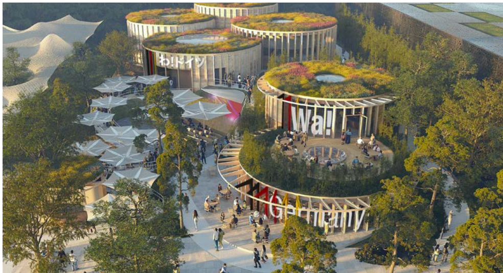
Der deutsche Pavillon auf der EXPO 2025 in Osaka