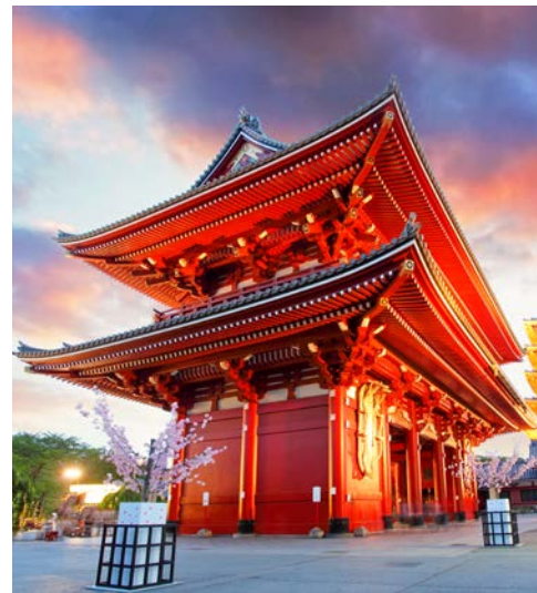
Der traditionelle Stadtteil Asakusa in Tokyo

Tor des Itsukushima-Schreins. Nur bei Flut ist dieses mit Wasser umspült, wobei es sich rot glitzernd im Wasser spiegelt. Bei Ebbe können Sie sogar ganz nah heran und es hautnah erleben. Am Nachmittag fahren Sie mit dem Shinkansen von Hiroshima nach Kyoto. (F)