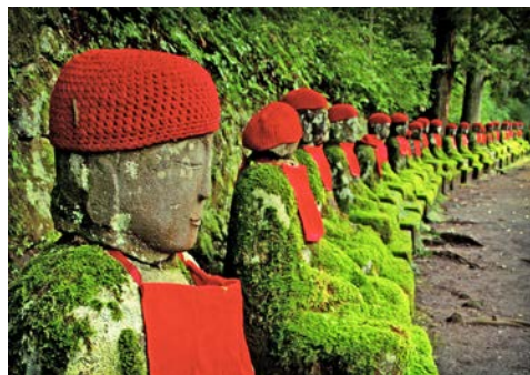
Buddhaallee in Nikko

Umgebung des Städtchens Nikko aus. Sie beginnen Ihre Besichtigung im Taiyuin-Tempel. Beeindruckend sind die unzähligen Schöpfungen der Holzschnitzkunst am Toshogu. Nikkos wichtigster Schrein, zugleich Mausoleum des ersten Tokugawa-Shoguns, wurde im 17. Jh. zur Zeit der Blüte von Architektur und Kunst geschaffen. Am frühen Abend Rückkehr nach Tokyo. Ca. 320 km (F)