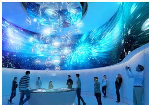
Erleben Sie die EXPO 2025

Unter dem Motto „Designing Future Society for Our Lives“ treffen sich die Länder der Welt vom 13. April bis zum 13. Oktober 2025 auf der EXPO in Osaka. Mit öffentlichen Verkehrsmitteln und in Begleitung Ihrer Reiseleitung fahren Sie nach Osaka zum ganztägigen Besuch der Weltausstellung. Auf dem EXPO-Gelände können Sie auf eigene Faust die zahlreichen Pavillons und Einrichtungen erkunden. Rückfahrt mit öffentlichen Verkehrsmitteln zu Ihrem Hotel in Kyoto. (F)