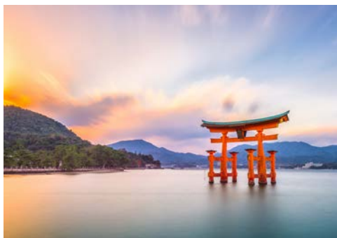
Itsukushima-Schreins während der Flut

Tor des Itsukushima-Schreins. Nur bei Flut ist dieses mit Wasser umspült, wobei es sich rot glitzernd im Wasser spiegelt. Bei Ebbe können Sie sogar ganz nah heran und es hautnah erleben. Am Nachmittag fahren Sie mit dem Shinkansen von Hiroshima nach Kyoto. (F)