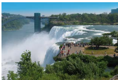
Ein möglicher Ausflug zu den Niagarafällen

Ein Tagesausflug (vorab buchbar) führt Sie heute zu einem der imposantesten Naturwunder der Welt: Mit donnerndem Getöse stürzt der Niagara-Fluss über die fast 1.000 m breite und 55 m tiefe Felsstufe, vor der Sie in einem Boot den spektakulären Blick auf das Naturphänomen aus nächster Nähe genießen. Danach folgen ein Spaziergang durch den von viktorianischen Häuschen geprägten Ort Niagara-on-the-Lake und eine Seilbahnfahrt über die Strudel des Niagara-Flusses. (F)