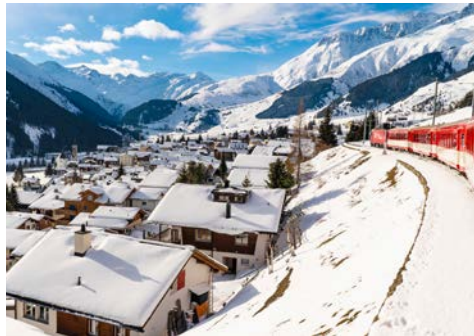
Mit dem Glacier Express durch die Winterlandschaft

Ihre Reise beginnt mit dem Flug nach Zürich. Am Flughafen Zürich werden Sie von Ihrer örtlichen Reiseleitung in Empfang genommen und auf Ihrem Weg ins Hotel nach Montreux begleitet, wo Sie für die nächste Nacht Ihr Hotel beziehen. Lassen Sie den Tag bei einem Spaziergang am Genfer See und einem gemeinsamen Abendessen ausklingen.