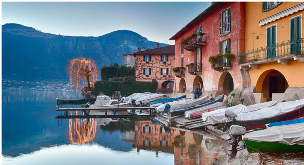
Italienischer Charme am Comer See