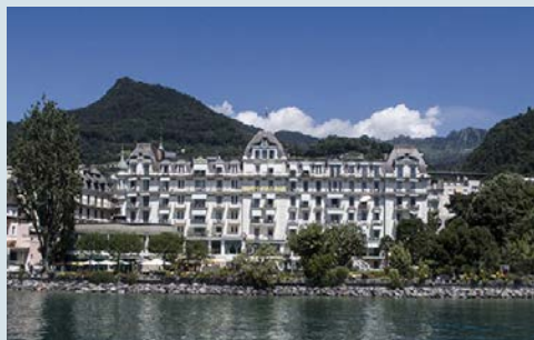
Direkt am Ufer – Eden Palace au Lac

Das Hotel Eden Palace au Lac bietet höchsten Komfort im Herzen der Stadt Montreux, an den Ufern des Genfer Sees. Die luxuriösen Deluxe-Zimmer mit Seeblick verfügen über eine durchschnittliche Fläche von 18 m 2 . Sie sind alle mit einem Badezimmer, einem Haartrockner, einer Minibar, einem Schreibtisch mit Telefon und einem Flachbildfernseher ausgestattet. In einem herzlichen Ambiente auf der Terrasse mit Blick über den Genfer See genießen Sie werden raffinierte Menüs des Chefs serviert.