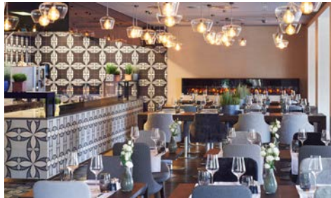
Hotel Belvedere – im Ristorante Fontana

Mit der erhöhten, privilegierten Lage über der Stadt Locarno überzeugt das Hotel Belvedere – das einzige 4-Sterne-Superior Hotel in Locarno – mit seiner großzügigen Aussicht auf den Lago Maggiore und auf die umliegenden Berge. Es ist das ganze Jahr der ideale Ort für einen erlebnisreichen Aufenthalt im Tessin. Das nur wenige Schritte vom historischen Zentrum Locarnos entfernte Belvedere liegt im Herzen einer einmaligen Umgebung, die reich an Sehenswürdigkeiten und Freizeitangeboten ist. Hier verwandelt sich jeder Moment in eine wertvolle Erinnerung. Das Oasi Belvedere erwartet alle Gäste ab Sommer 2024 mit 800 m 2 Innen- und 1.400 m 2 Außenanlage für pures Wohlbefinden.