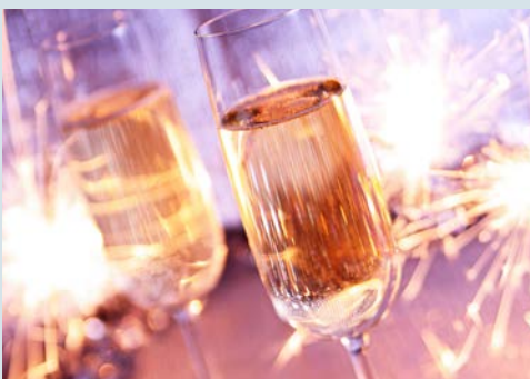
Stoßen Sie auf das neue Jahr 2025 an!

Nach einem gemütlichen Frühstück fahren Sie an den Comer See, mit bis zu 400 m Tiefe ist er der tiefste Alpensee. Vorbei an herrschaftlichen Villen und prächtigen Sommerresidenzen, die in weiß und gelb durch die subtropische Fauna der Parks schimmern, gelangen Sie zur Villa Carlotta, einem 1747 errichteten Palazzo. Über eine Doppelterrasse, die sich über fünf ansteigende Terrassen erstreckt, erreichen Sie die repräsentativen Innenräume. Die Villa verdankt ihren Namen der Tochter von Prinzessin Marieanne von Preußen, Charlotte, die für Botanik und