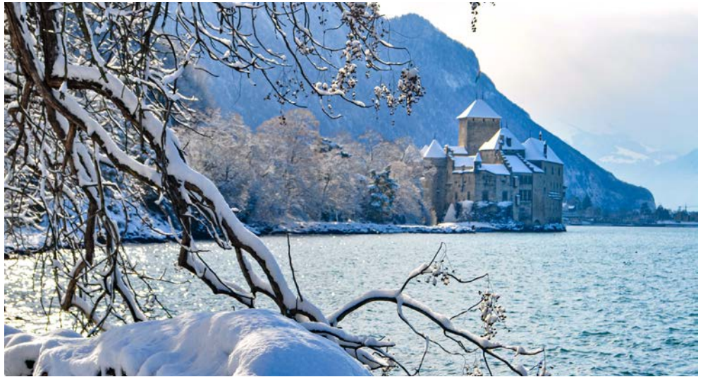
Schloss Chillon am Ufer des Genfer Sees nahe Montreux

Ein wahres Wintermärchen erwartet Sie zum Jahresausklang. Lassen Sie sich von der Winterlandschaft der Berner und Walliser Alpenwelt verzaubern. Ein Stück reine Natur mit schneebedeckten und urigen Bergwäldern, stillen Alpweiden, zu Eis erstarrten Bergbächen und traditionsreichen Bergdörfern erwartet Sie auf der Panoramafahrt durch die Hochalpen mit dem weltberühmten Glacier Express. Genießen Sie mediterranes Klima im Palmenparadies des Lago Maggiore. Lernen Sie die norditalienische Kleinstadt Como kennen und erfahren Sie südländisches Flair bei einem Bummel durch die Gassen von Locarno und Ascona. Freuen Sie sich auf einen Ausflug nach Bellinzona und entdecken Sie auf einem buchbaren Ausflug die wunderschöne Natur auf einer Schiffsfahrt auf dem Luganer See und begeben Sie sich auf die Spuren von Hermann Hesse in Lugano. Bei einem gemeinsamen Silvesterdinner stoßen Sie auf ein glückliches Jahr 2025 an.