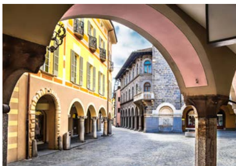
Wunderschöne Arkaden in Bellinzona

Gartenkunst schwärmte. Anschließend besuchen Sie Como, das auf eine römische Gründung zurückgeht. 1510 wurde hier die erste Seidenmanufaktur durch den Tuchhändler Pietro Boldoni errichtet. Im 19. Jh. war die „pura seta di Como“, die „Reine Seide aus Como“, bei Adligen und Königen in ganz Europa begehrt und noch bis heute ist die Seidenverarbeitung wichtiger Bestandteil der Stadt. Eine Stadtführung wird Sie durch die Città Murata, die weitummauerte Altstadt, zu den Hauptsehenswürdigkeiten bringen und Sie den quicklebendigen Charme der Stadt erfahren lassen. Diesen eindrucksvollen Tag rundet erneut ein gemeinsames Abendessen ab.