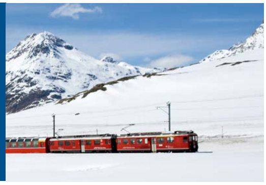
Der Glacier Express

Zusätzlich nur vorab buchbar: Ausflug Lugano mit Schiffsfahrt/ Stadtführung, Besuch Hermann Hesse Museum € 99,-