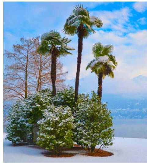
Unter Palmen ins neue Jahr

Gartenkunst schwärmte. Anschließend besuchen Sie Como, das auf eine römische Gründung zurückgeht. 1510 wurde hier die erste Seidenmanufaktur durch den Tuchhändler Pietro Boldoni errichtet. Im 19. Jh. war die „pura seta di Como“, die „Reine Seide aus Como“, bei Adligen und Königen in ganz Europa begehrt und noch bis heute ist die Seidenverarbeitung wichtiger Bestandteil der Stadt. Eine Stadtführung wird Sie durch die Città Murata, die weitummauerte Altstadt, zu den Hauptsehenswürdigkeiten bringen und Sie den quicklebendigen Charme der Stadt erfahren lassen. Diesen eindrucksvollen Tag rundet erneut ein gemeinsames Abendessen ab.