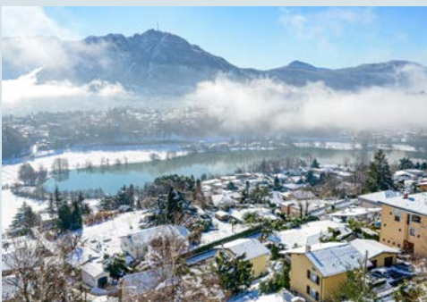
Lago di Muzzano in Lugano mit Blick auf Montagnola