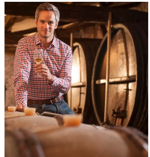
Kosten Sie Weine vom Bodensee

Den heutigen Tag beginnen Sie mit einem Ausflug nach Salem, wo inmitten einer großzügigen Park- und Gartenanlage das ehemalige Zisterzienserkloster und heutige Schloss Salem liegt. Auf einem geführten Rundgang durchschreiten Sie sieben Jahrhunderte Architektur. Sie betreten die ehemalige Reichsabtei Salem, die zu den größten Zisterzienserklöstern im süddeutschen Raum zählt, und erhalten Einblicke in die prachtvollen Innenräume des Schlosses, wie den Kaisersaal und die privaten Räume des Abtes. Nach einem gemeinsamen Mittagessen auf dem Schlossgelände fahren Sie nach Unteruhldingen, wo Sie eine geführte Zeitreise durch das älteste Freilichtmuseum Deutschlands, dem Pfahlbauten Museum, unternehmen. Zum Weltkulturerbe gehörend, liegt es idyllisch am ersten Naturschutzgebiet des Bodensees. Vom großartigen Seepanorama begleitet, erkunden Sie auf Stegen über dem Wasser die Pfahlbaudörfer, deren Entstehung bis in die Stein- und Bronzezeit zurück geht. Im Anschluss entführt Sie der Winzerverein auf einen kleinen Spaziergang in die Weinberge und weicht Sie in die jahrhundertalte Weingeschichte am