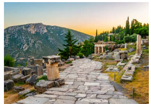
Orakel von Delphi

Heute besichtigen Sie Delphi, den „Nabel“ der antiken Welt, eine der wohl bedeutendsten Ausgrabungen Europas. Terrassenförmig eingefügt liegt das antike Heiligtum an den grünen Berghängen des Parnassos und bietet traumhafte Ausblicke in die hügelige Ebene mit seinen Olivenplantagen, die bis ans Meer hin reichen. Ein Rundgang durch die alten Ruinen und Tempelanlagen lässt noch heute den Besucher die Magie der alten Orakelstätte spüren. Nach einer Pause mit Gelegenheit zum Mittagessen in der Ortschaft Delphi geht es wieder zurück zum Hotel (ca. 530 km).