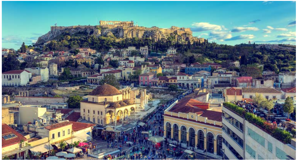
Die Akropolis thront oberhalb von Athen

Peloponnes war einst die Wiege der ersten Hochkultur Europas und hat viele Kulturstätten wie Olympia, Epidauros und Mykene zu bieten. Vor allem geschichtlich ist die Region Einzigartig. Ein Tagesausflug führt zudem nach Athen, wo die Akropolis und die Plaka besucht werden. Bequem, ohne lästiges Kofferpacken, erkunden Sie eine der abwechslungsreichsten Gegenden Griechenlands. Bilderbuchschöne Aussichten bieten Berge, Schluchten und verträumte Meeresbuchten, traditionelle Dörfer und alte Klöster. Hier werden noch griechische Traditionen gelebt, die Gastfreundschaft ist sprichwörtlich!