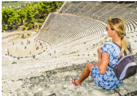
Amphitheater in Epidauros

Nach der Ankunft am Flughafen von Athen erfolgt der Transfer zum Hotel bei Vrachati (ca. 130 km).