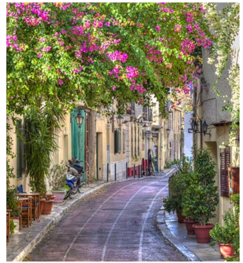
In der Plaka (Altstadt) von Athen

Heute geht es in die Landeshauptstadt. Sie beginnen zunächst mit einer Stadtrundfahrt in Athen. Vorbei am Zeustempel, dem königlichen Palast, dem Parlament und dem Syntagma-Platz fahren Sie zur Akropolis, von wo Sie einen wunderbaren Blick über Athen haben. Freizeit mit Gelegenheit zum Mittagessen in der Plaka. Anschließend Spaziergang durch die Altstadt zum Akropolismuseum (ca. 260 km). Nach der Besichtigung Rückfahrt ins Hotel.