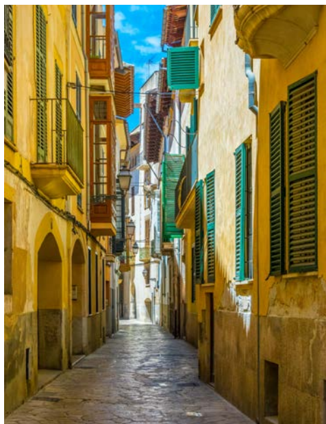
Die Altstadt von Mallorca

Mit vielen „neuen Erinnerungen im Gepäck“ treten Sie Ihre Heimreise an.