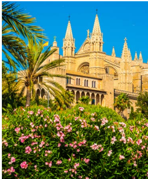
Palma de Mallorca, Kathedrale La Seu

Lernen Sie die Kontraste der bezaubernden Inselmetropole kennen. Palma de Mallorca, die Hauptstadt der Balearen, zählt zu den schönsten Städten des Mittelmeeres. Mit ca. 425.000 Einwohnern lebt hier die Hälfte der Gesamtbevölkerung Mallorcas. Lassen Sie sich von der Lage der „La Ciutat“ (die Stadt) an einer der herrlichsten und, mit 20 km Länge, einer der großzügigsten Buchten des Mittelmeerraumes beeindrucken. Ein geführter Stadtrundgang durch die Altstadtgassen mit ihren sehenswerten, historischen Bauwerken und Innenhöfen, ein Besuch der berühmten Kathedrale und die anschließende Panorama-Rundfahrt zur Festung Bellver, wo Sie den schönen Blick über die Stadt und die Hafenanlagen genießen können, runden diesen halbtägigen Ausflug ab.