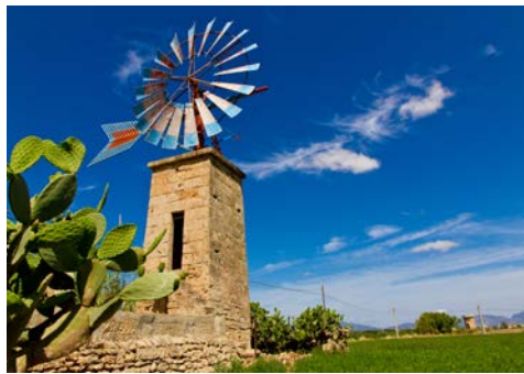
Windmühlen mit Tradition

Jahren geschaffen wurde. Am Nachmittag fahren Sie nach Randa, einem hübschen Dorf auf dem Wege zum Berg Randa. Auf dem Gipfelplateau in 542 m Höhe befinden sich drei Klöster. Sie sind das Ziel der Ausflügler und Wallfahrer zum Berg des Ramón Lull, einem der größten Söhne Mallorcas. Bei klarem Wetter können Sie die gesamte Insel überblicken. Danach Rückfahrt zum Hotel.