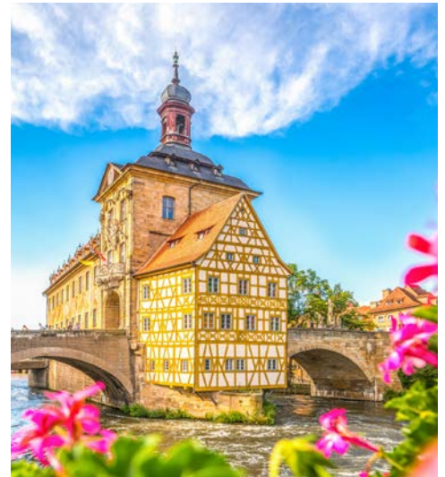
Altes Brückenrathaus in Bamberg

Der heutige Vormittag gilt ganz dem Kreuzen auf dem Main. Bei Haßfurt endet das fränkische Weinanbaugebiet am Main und das Bierland Franken beginnt. Hier verändert sich die Landschaft und wird deutlich flacher. Nach dem Mittagessen erreicht Ihr Schiff schließlich gegen 14.30 Uhr Bamberg. Das UNESCO Weltkulturerbe begeistert Besucher als Ort erlebbarer Geschichte und als lebendig-quirlige Kulturstadt. Auch die Bierkultur wird hier groß geschrieben, so viele Brauereigaststätten und lokale Bierspezialitäten wie in Bamberg gibt es kaum woanders. Entscheiden Sie sich heute entweder für den