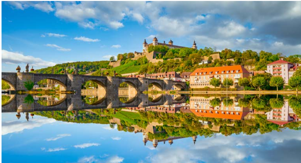
Die Festung Marienberg thront über Würzburg

Genießen Sie den zweiten Nachmittag auf dem Main bei der Passage von Wertheim nach Würzburg. Die beiden Städte liegen zwar nicht weit auseinander, durch das sogenannte Main-Dreieck gestaltet sich diese lange Flussetappe jedoch als perfekte Gelegenheit, die Seele baumeln zu lassen. Die malerische und geschichtsträchtige Strecke führt vorbei an kleinen Städten wie Marktheidenfeld und Rothenfels – die kleinste Stadt Bayerns. Weiter über Lohr nach Karlstadt, wo die imposante Karlsburg majestätisch über dem Fluss thront. In dieser wunderschönen Kulisse erwartet Sie schließlich das Gala-Dinner am Abend mit einem festlichen Menü an Bord.