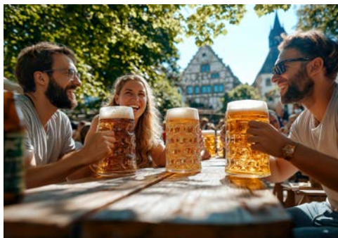
Haben Sie Lust auf eine Bierprobe in Bamberg?

Genießen Sie den zweiten Nachmittag auf dem Main bei der Passage von Wertheim nach Würzburg. Die beiden Städte liegen zwar nicht weit auseinander, durch das sogenannte Main-Dreieck gestaltet sich diese lange Flussetappe jedoch als perfekte Gelegenheit, die Seele baumeln zu lassen. Die malerische und geschichtsträchtige Strecke führt vorbei an kleinen Städten wie Marktheidenfeld und Rothenfels – die kleinste Stadt Bayerns. Weiter über Lohr nach Karlstadt, wo die imposante Karlsburg majestätisch über dem Fluss thront. In dieser wunderschönen Kulisse erwartet Sie schließlich das Gala-Dinner am Abend mit einem festlichen Menü an Bord.