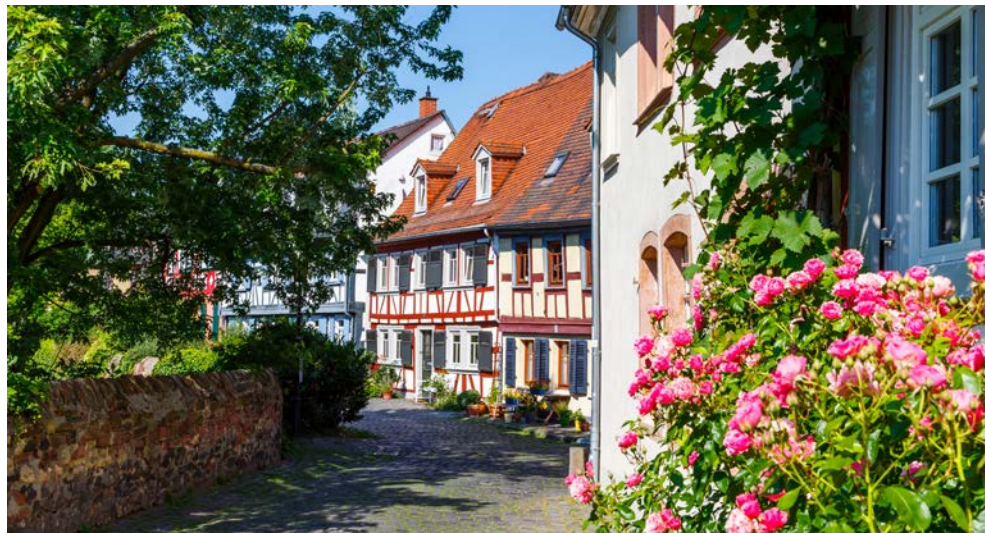
Altstadt-Idylle in Frankfurt