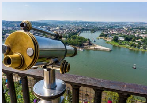
Blick auf das Deutsche Eck in Koblenz