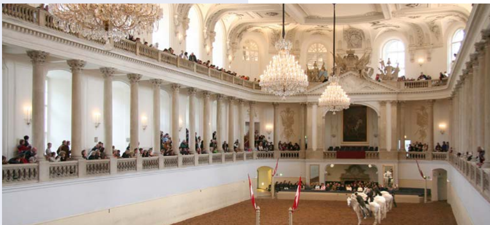
Morgentraining in der Spanischen Hofreitschule