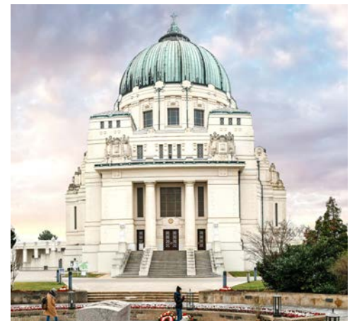
Die „Lueger Kirche“ auf dem Zentralfriedhof Wiens