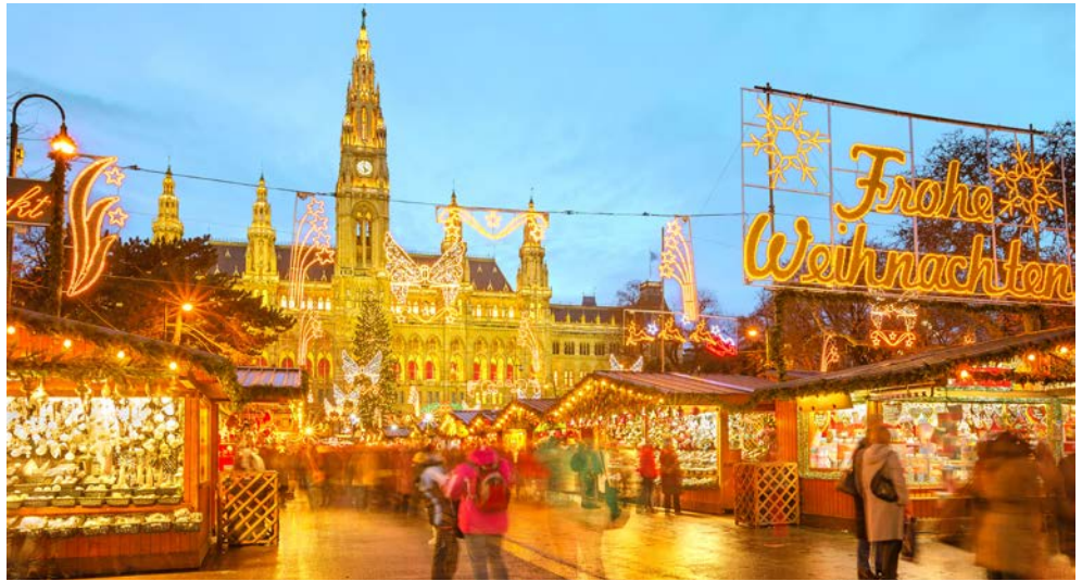
Der Wiener Christkindlmarkt

Es gibt viele gute Gründe, nach Wien zu reisen: Die Stadt ist weltberühmt für ihr prächtiges imperiales Erbe, für die Schlösser Schönbrunn und Belvedere sowie für die Hofburg. Wien punktet mit einem hochkarätigen Musik- und Kulturangebot, Wien steht für eine ausgereifte Genussskultur, die sich über Jahrhunderte in den Kaffeehäusern und Heurigen etabliert hat, und Wien überzeugt mit seinen herrlich angelegten Parkanlagen. Doch in der Vorweihnachtszeit begeistert die Gäste noch etwas anderes: Bereits seit über 700 Jahren besitzt der Wiener Christkindlmarkt eine ganz besondere Atmosphäre – bei einem gemütlichen Bummel sollten Sie schnell feststellen warum. Der perfekte Auftakt für Ihr „Vorweihnachtsgefühl“ in diesen turbulenten Zeiten.