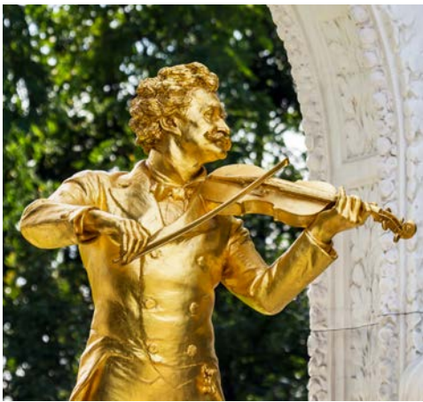
Denkmal des „Walzerkönig“ Johann Strauss

Der restliche Tag steht Ihnen zur freien Verfügung. Lassen Sie sich von der Stimmung der Stadt mitreißen und treiben. Es gibt so viel zu entdecken. Vielleicht genießen Sie ja auch ein Stück Sachertorte oder eine Führung in der weltberühmten Oper? Es ist für jeden etwas dabei.