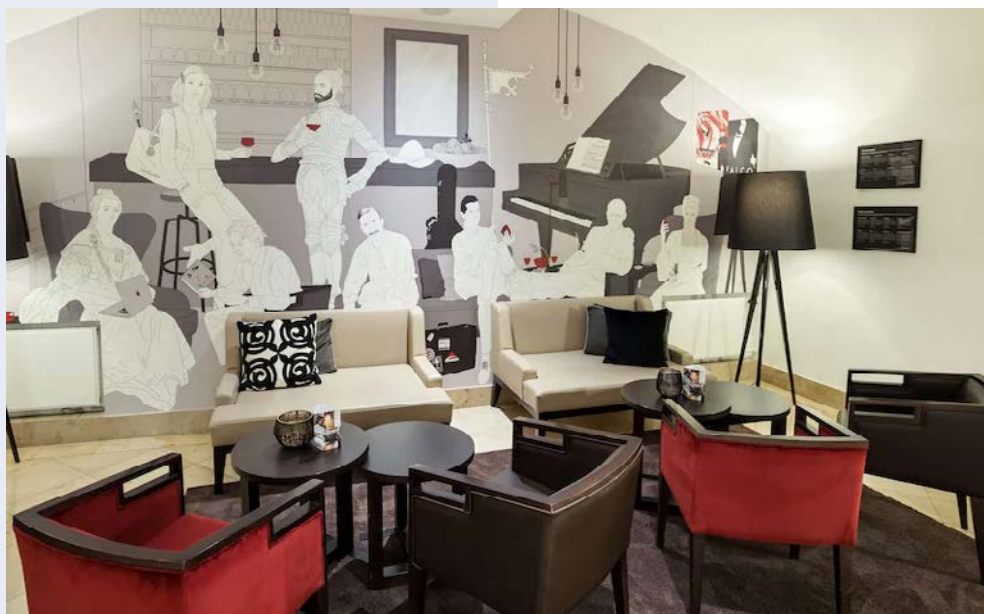
Hotel Rathauspark Wien – Lobby mit Sitzbereich

Weitere buchungsrelevante Informationen zu dieser Reise (An- und Abreise, Gesundheitshinweise, Barrierefreiheit, eventuell anfallende Mehrkosten während der Reise etc.) erhalten Sie im Internet unter: www.hanseatreisen.de