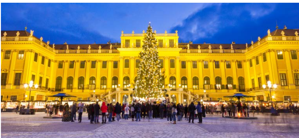
Willkommen in Schönbrunn