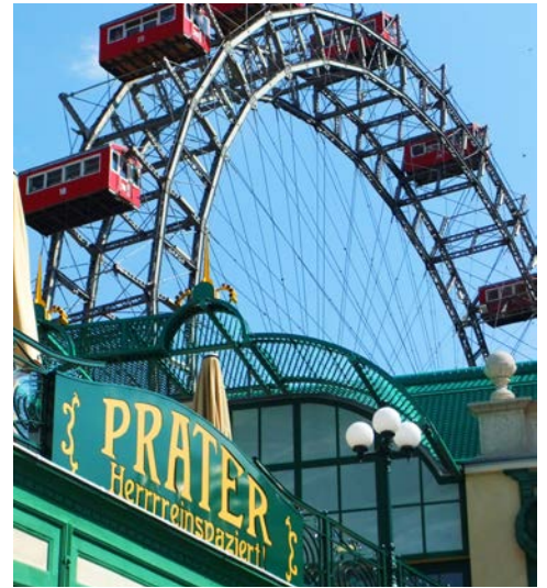
Wie wäre es mit einer Fahrt?