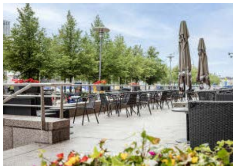
Die Terrasse Ihres Hotels

Kingsize-Betten von 180 cm Breite. Die Standard-Einzelzimmer sind ca. 16 qm groß. Weitere Zimmerkategorien stehen je nach Verfügbarkeit gegen Aufpreis zur Verfügung.