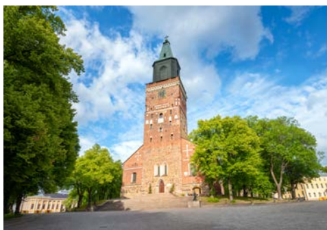
Der Dom zu Turku – im Jahr 1300 zur Kathedrale geweiht

Nach dem Frühstück und dem Check-out, deponieren Sie das Gepäck im verschlossenen Gepäckraum des Hotels. Der Rückflug nach Deutschland erfolgt erst gegen 16 Uhr. Somit bleibt Ihnen noch genügend Zeit zur eigenen Verfügung.