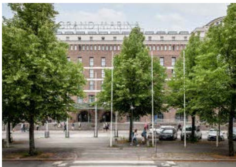
Ihr Hotel Scandic Grand Marina