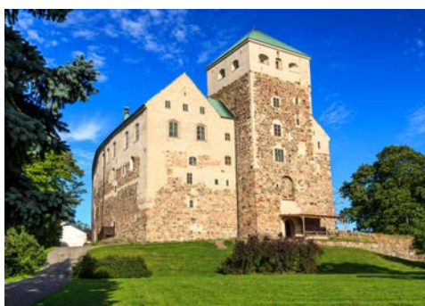
Das Schloss Turun Linna in Turku

Schäreninseln. Der Dom von Turku gilt als Nationalheiligtum Finnlands und ist den meisten Finnen schon deshalb bekannt, weil sein Glockenläuten täglich um 12 Uhr mittags über das Radio gesendet wird. Der Dom ist zudem die einzige mittelalterliche Kathedrale Finnlands. Während des geführten Stadtrundgangs sehen Sie u.a. den Alten Markt, der von prächtigen Gebäuden umgeben ist. Zurück in Helsinki steht Ihnen der sommerliche Abend zur freien Verfügung. Wie wäre es zum Beispiel mit dem Besuch einer öffentlichen Sauna und Badestelle? Ihre Reiseleitung kann Ihnen sicherlich auch diese Frage beantworten!