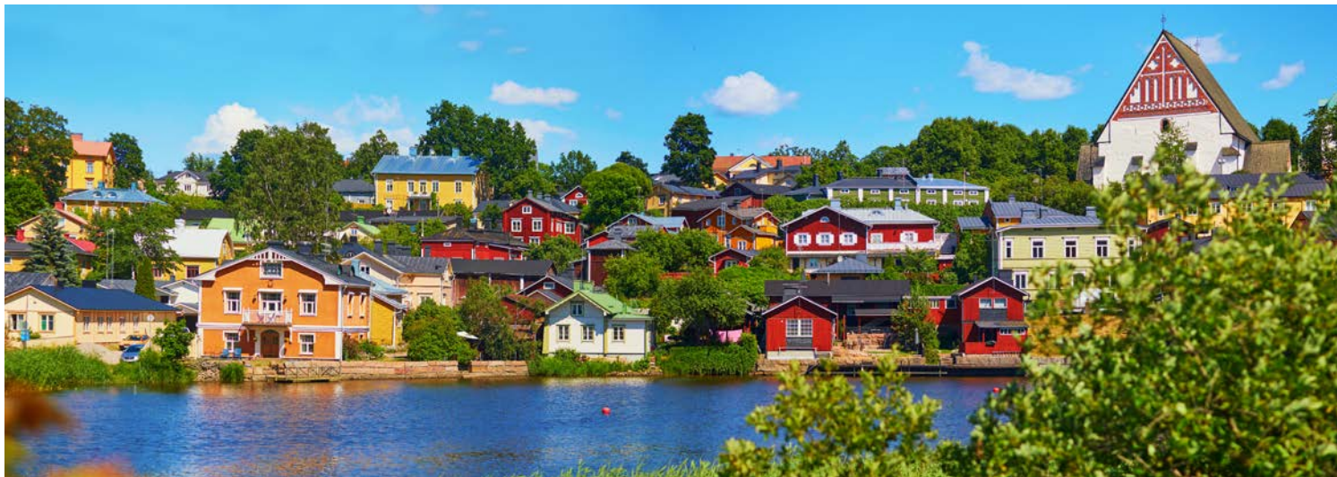
Traumhafts Städtchen – Porvoo

Zunächst unternehmen Sie einen ausgiebigen Spaziergang im Sibelius-Park mit dem beeindruckenden Sibelius-Monument. Anschließend fahren Sie in das etwa 40 km entfernte Järvenpää, wo sich um die Jahrhundertwende zahlreiche Künstler niederließen. Der Komponist Jean Sibelius lebte von 1904 bis zu seinem Tod 1957 in der Villa Ainola, zwei Kilometer südlich des Stadtzentrums mit Blick auf den Tuusulanjärvi-See. Hier komponierte er fünf seiner sieben Symphonien. Heute ist das nach Sibelius' Frau Aino benannte Haus ein Museum, welches von Ihnen besichtigt wird. Der Schriftsteller Juhani Aho lebte ebenso wie der Kunstmaler Eero Järnefelt am See. Am gegenüberliegenden Ufer befindet sich die von Alvar Aalto erbaute Villa des Komponisten Joonas Kokkonen. Dem Wirken der Künstlerkolonie in Järvenpää widmet sich das 1992 eröffnete Kunstmuseum (der Eintritt ist nicht inkludiert). Zurück in Helsinki steht Ihnen der Nachmittag zur freien Verfügung. Ihre Reisebegleitung gibt Ihnen gern Tipps für einen Einkaufsbummel oder andere schöne Dinge, die es hier zu erleben gibt.