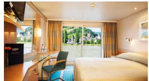
Beispielkabine: Mittel- und Oberdeck