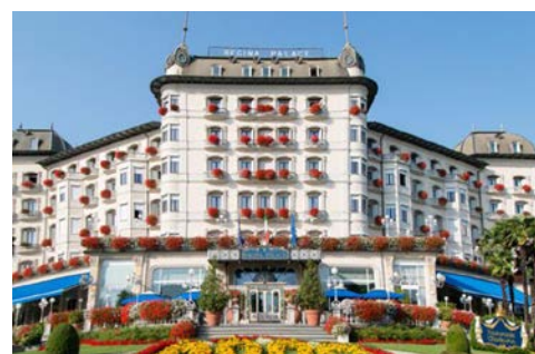
Das Hotel Regina Palace

Heute heißt es „Arrivederci Italia“. Es erfolgen der Transfer zum Flughafen Mailand und der Rückflug nach Deutschland.