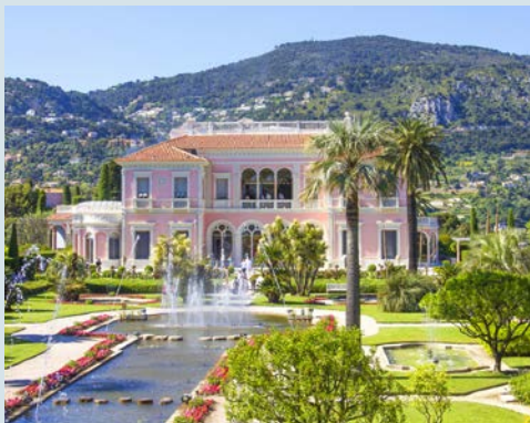
Die Villa Ephrussi de Rothschild