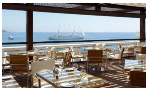
Restaurant, Dachterrasse, witterungsbedingt geöffnet