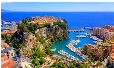
Blick auf den Palast in Monaco

Heute lernen Sie die traumhafte Gegend der französischen Riviera etwas näher kennen. Am frühen Nachmittag besuchen Sie die legendäre Villa Ephrussi, herrlich auf der Halbinsel Cap Ferrat gelegen. Von der Schönheit der Küstenlandschaft bezaubert, ließ sich die Pariser Kunstsammlerin Béatrice de Rothschild hier zu Beginn des 20. Jahrhunderts ein Anwesen im italienischen Renaissance-Stil errichten: die Villa Ephrussi de Rothschild. Die Baroness stammte aus der jüdischen Bankiersfamilie Rothschild. Béatrice ließ, wie der Besuch zeigen wird nicht nur einen Innenhof mit Laubengängen zur Ausstellung ihrer Sammlung, sondern auch mehrere opulente Salons anlegen. Besonders beeindruckend ist zudem die Parkanlage des Anwesens, mit herrlicher Lage über dem Meer gelegen. Der Besuch endet mit dem gemeinsamen Kaffee und Tee im Salon. Nach diesen eindrucksvollen Impressionen, fahren Sie zurück zum Hotel. Der Abend steht Ihnen zur freien Verfügung.