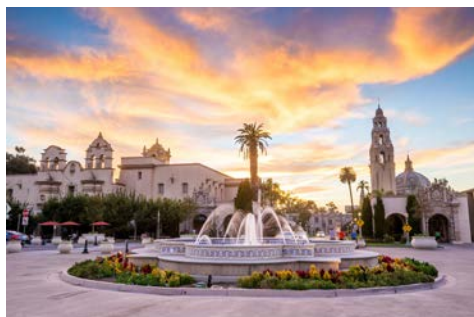
Balboa Park in San Diego