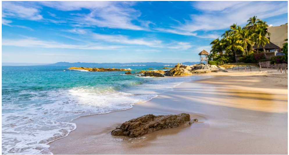
Conchas Chinas Strand in Puerto Vallarta