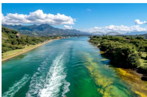
Die KONINGSDAM passiert den Panamakanal