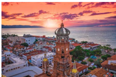
Blick über Puerto Vallarta mit Glockenturm

Wie schön, Sie beginnen die Kreuzfahrt mit zwei entspannten Tagen an Bord.