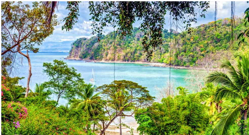
Atemberaubende Natur in Costa Rica