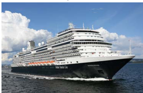
Erholung pur an Bord

Ihr Lieblingsplatz an Bord wartet auf Sie ... auf dem Sonnendeck? In Ihrer komfortablen Kabine? In einer der vielen Bars und Lounges?