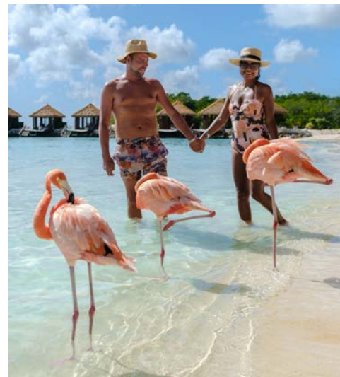
Begegnungen am Strand von Aruba