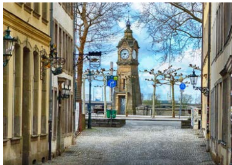
Blick von der Altstadt zum Rheinufer

Nach Ihrer individuellen Anreise nach Düsseldorf beziehen Sie ab 15 Uhr Ihre eleganten Zimmer im Living Hotel de Medici direkt in der Düsseldorfer Altstadt. Das exklusive Hotel ist im ehemaligen Stadthaus untergebracht und ist hinsichtlich des Designs eine Hommage an die großen Kunstschätze Europas. Um 17 Uhr lernen Sie bei einem Sektempfang die HANSEAT-Reisebegleitung kennen. Entdecken Sie im Anschluss bei einer Führung durch das hochkarätige Hotel die zahlreichen Kunstschätze und lassen Sie sich von der einmaligen Privatsammlung inspirieren. Um 19 Uhr werden Sie im zugehörigen Feinschmecker-Restaurant zu einem Abendessen erwartet und lassen den Anreisetag gesellig ausklingen.