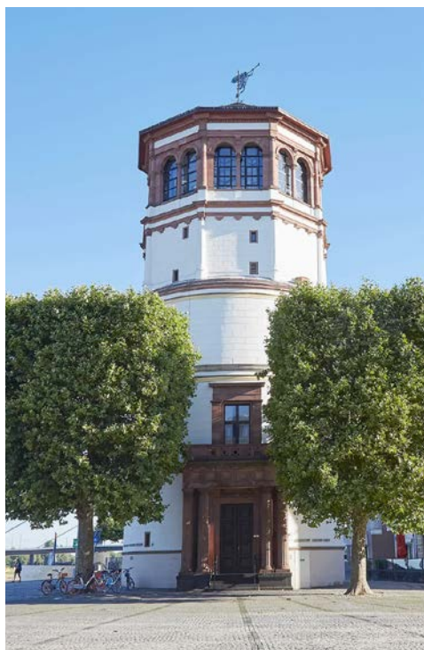
Der Schlossturm am Burgplatz

Sie genießen noch einmal das reichhaltige Frühstücksbuffet und können Ihre Hotelzimmer bis 12 Uhr nutzen, bis Sie Ihre individuelle Heimreise antreten.