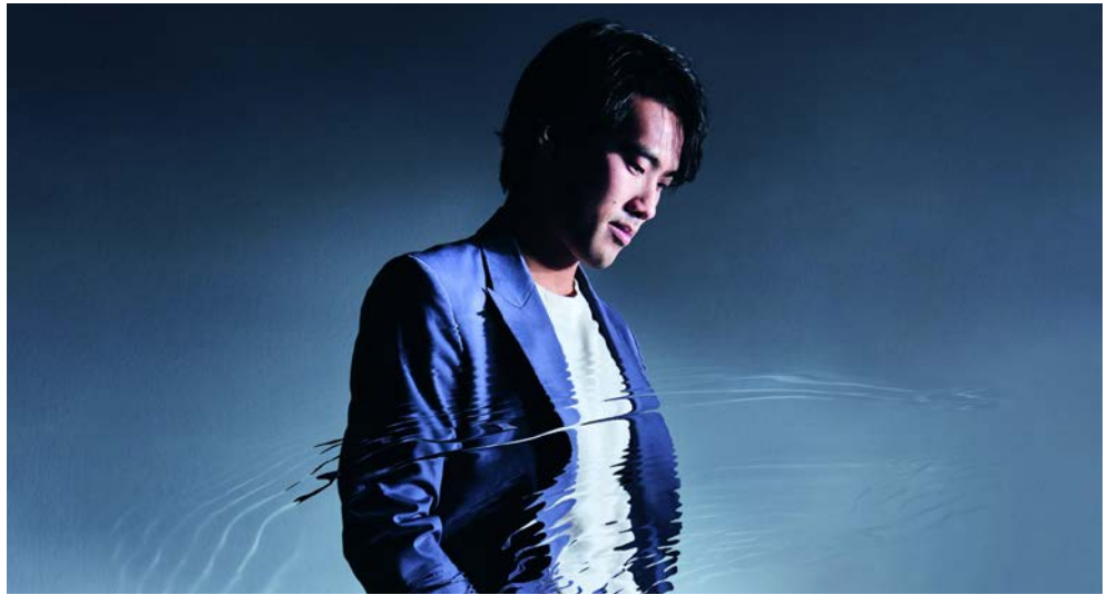
Der Ausnahme-Pianist Bruce Liu

Ihr einzigartiges Hotel erwartet Sie im Herzen der historischen Altstadt zwischen Rheinufer und Königsallee. Das denkmalgeschützte Gebäude beherbergt eine einmalige Kunstsammlung und ist somit Museum, Hotel und Denkmal in einem.