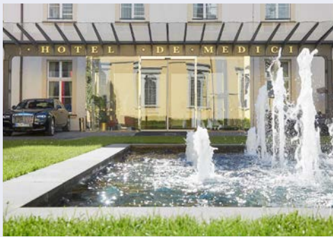
Ihr Living Hotel de Medici

Das Living Hotel de Medici Düsseldorf erwartet Sie mitten im Herzen der historischen Altstadt zwischen Rheinufer und Königsallee. Es ist im denkmalgeschützten Gebäude des ehemaligen Stadthauses untergebracht und beherbergt zudem eine einmalige Kunstsammlung. Alle Zimmer sind klimatisiert und verfügen über einen Sitzbereich, Kabel-TV und kostenfreies WLAN. Ein gehobenes Restaurant unter historischer Kassettendecke, eine ausgezeichnete Bar und ein Wellnessbereich mit Fitnessraum runden das Hotelangebot ab. Freuen Sie sich auf Kreuzgewölbe, Sternparkett und Marmor und residieren Sie fürstlich.