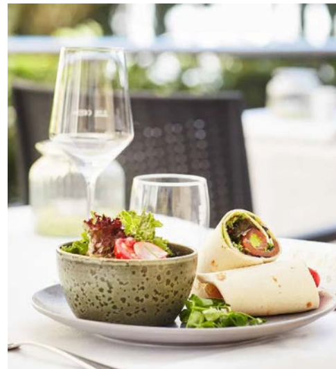
Lassen Sie sich im Hotel verwöhnen