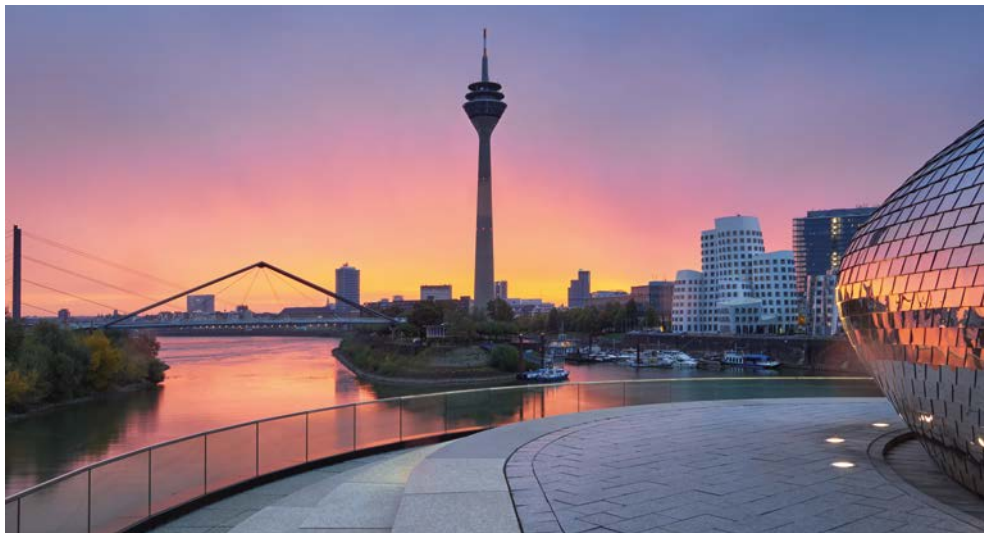
Der Medienhafen in Düsseldorf

frühen Kindheitserfahrungen stets prägend für den Künstler bleiben. Ab 11.15 Uhr erhalten Sie eine Sonderführung durch die Kunstsammlung Nordrhein-Westfalen, die dem russisch-französischen Maler eine umfassende Sonderausstellung mit rund 90 Gemälden und Papierarbeiten aus allen Schaffensphasen widmet. Dabei legt die Schau einen besonderen Fokus auf die frühen Werke, die zwischen 1910 und 1923 entstanden sind. Chagalls fantastisch-poetische Bildwelten faszinieren und geben – so vertraut sie uns sind – stets aufs Neue Rätsel auf. Stilistisch wie inhaltlich bewegt sich sein künstlerisches Schaffen zwischen Tradition und Avantgarde. Chagall hat die Entwicklungen der Kunst des 20. Jahrhunderts vom Primitivismus über Kubismus, Fauvismus und Surrealismus durchlebt und daraus eine ganz eigene Bildsprache für sich entworfen. Unverkennbar ist dabei auch die essentielle Kontinuität in einem zugleich vielfältigen künstlerischen Ausdruck. Nach der Führung haben Sie genügend Zeit, sich den Kunstwerken zu widmen, denn die Kunsthalle liegt fußläufig zu Ihrem Hotel.