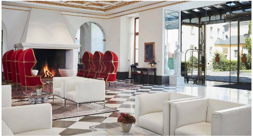
Die Lobby Ihres Hotels