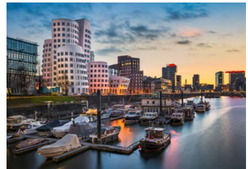
Die „Tanzen Türme“ von Frank O. Gehry