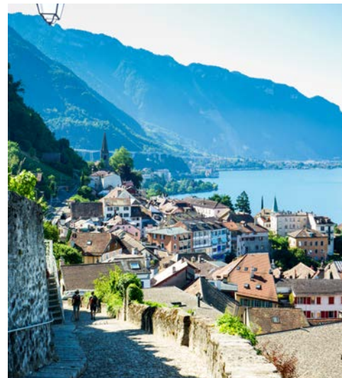
Montreux abseits der mondänen Uferpromenade