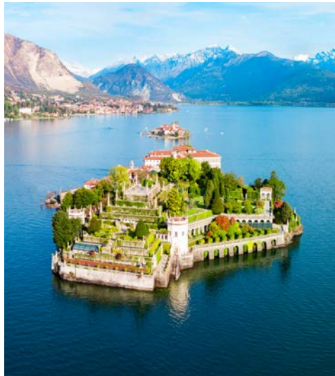
Die Isola Bella, „die schöne Insel“ im Lago Maggiore

bietet ihren Besuchern eine Komposition aus Hochkultur, Kunst und Architektur, Historie, Mode und Design. Mailand hat viele Gesichter und jedes ist für sich eine Reise wert. Bei einer Stadtführung lernen Sie die italienische Metropole kennen.