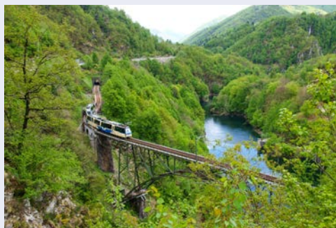
„Centovalli“ bedeutet hundert Täler

Der Tag steht Ihnen zur freien Verfügung. Wer mag, unternimmt einen zusätzlich buchbaren Ausflug nach Mailand. Die Stadt lockt mit Facettenreichtum und