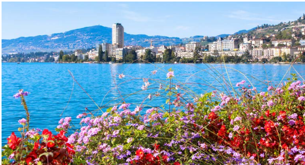
Willkommen in Montreux