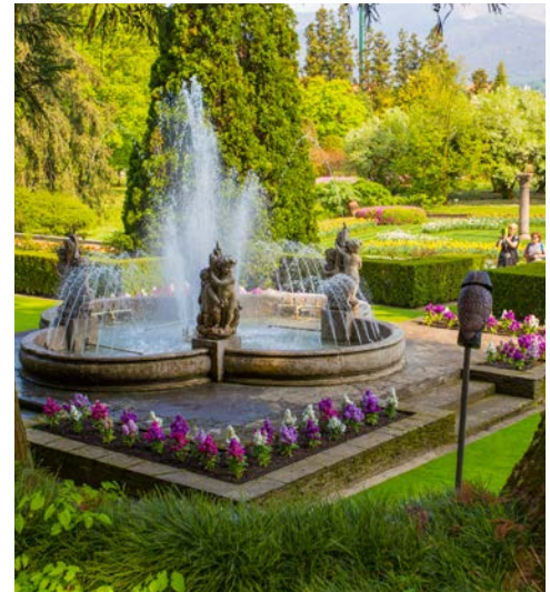
Zauberhaft – Botanischer Garten der Villa Taranto

Heute unternehmen Sie einen Ausflug an den Lago d’Orta mit der weltbekannten Basilika San Giulio auf der Insel San Giulio, die Sie per Boot erreichen. Im Inneren erwarten Sie kostbare Elemente der spätgotischen und barocken Epoche. Das pittoreske