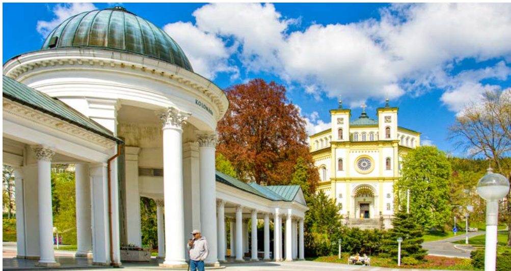
Kolonnade der Karolinenquelle