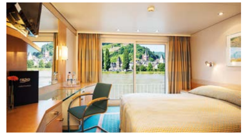
Beispielkabine: Mittel- und Oberdeck