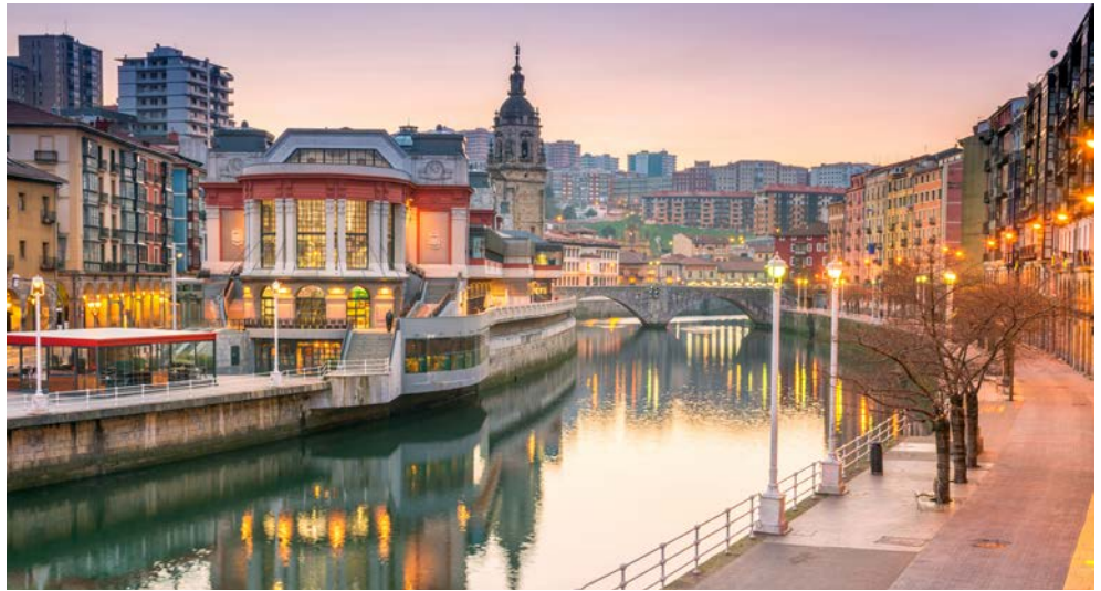
Willkommen in Bilbao

Die baskische Küche, die im Übrigen für Ihre Kreativität gelobt wird und mit einer Vielzahl an Sterneköchen aufwartet, wird Sie begeistern. Auch die hervorragenden Weine der Region können von Ihnen probiert werden.