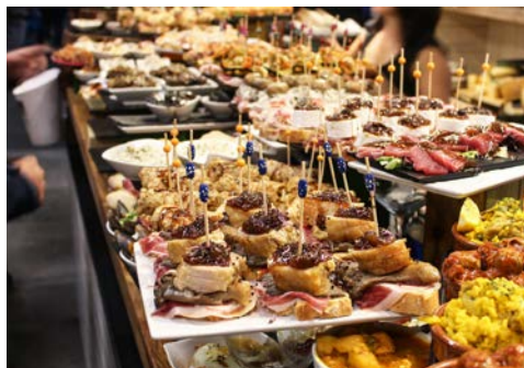
Genießen Sie eine schöne Pintxos-Tour

Da Sie erst am Nachmittag zurück nach Deutschland fliegen, steht der Tag für weitere Besichtigungen zur Verfügung. Das Zimmer verlassen Sie bis 10 Uhr, anschließend deponieren Sie das Gepäck im verschlossenen Gepäckraum des Hotels. Der Transfer vom Hotel zum Flughafen erfolgt am frühen Nachmittag.