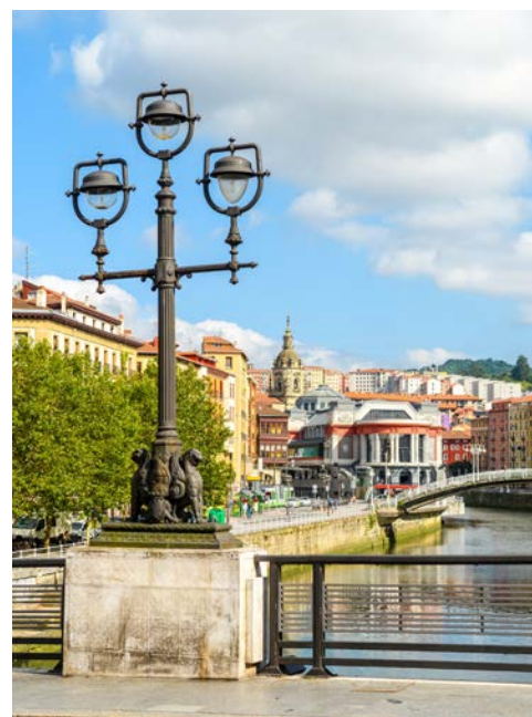
Blick auf die Altstadt