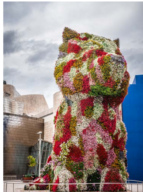
Blumen-Skulptur „Puppy“ vor dem Guggenheim Museum