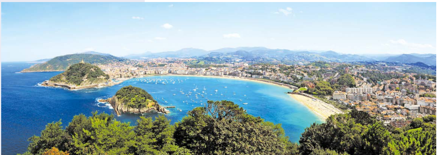
Besuchen Sie das wunderschöne San Sebastian

Am Vormittag lernen Sie das Zentrum Bilbaos näher kennen und spazieren mit ihrer Reiseleitung vom