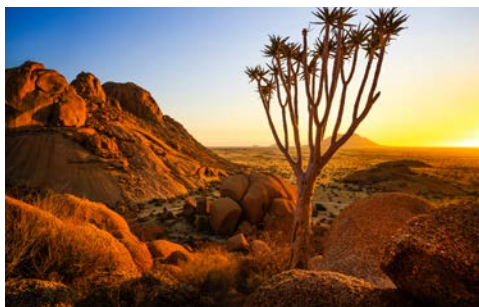
Ein kleines Idyll in der Wüste – Etosha-Nationalpark