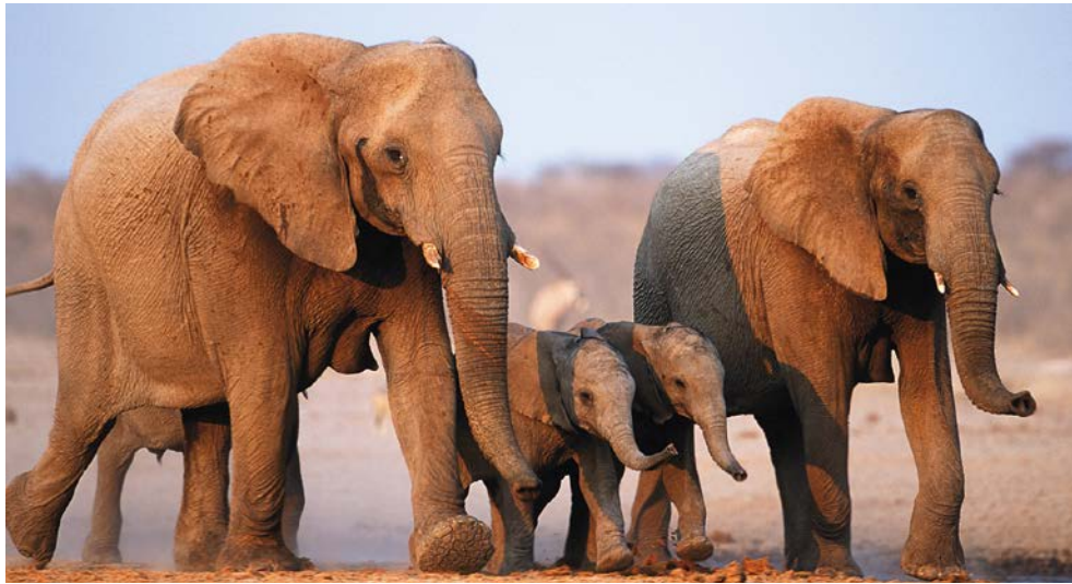
Erleben Sie Elefanten hautnah!