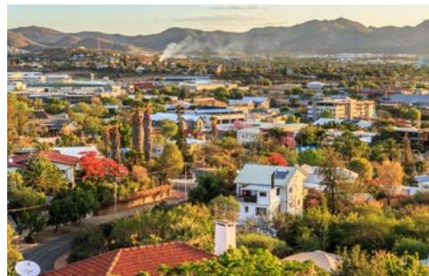
Windhoek – Wirtschafts- und Kulturzentrum des Landes

Der Vormittag steht für eine Pirschfahrt zur Verfügung. Anschließend fahren Sie nach Otjiwarongo, wo Ihr Zug bereitsteht. (F/A)