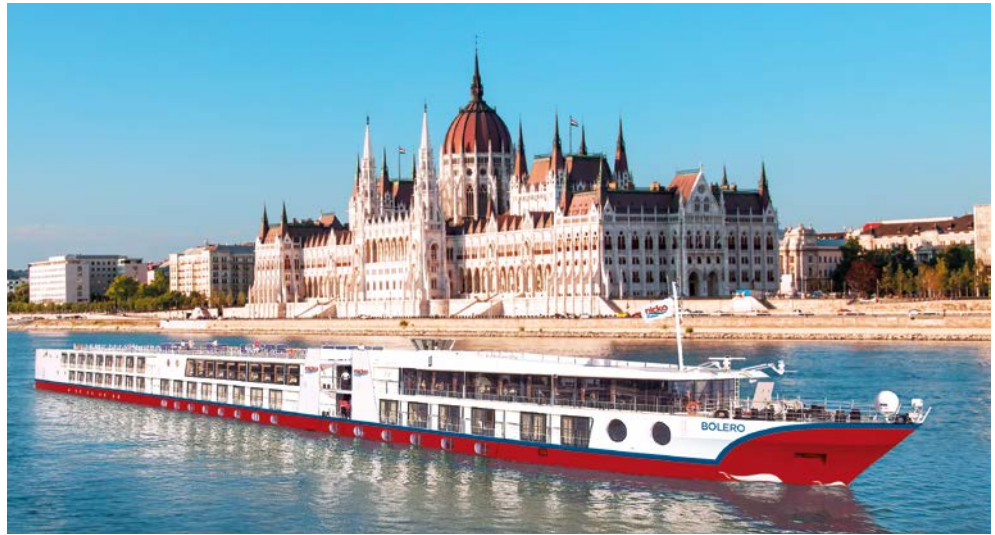
Die BOLERO in Budapest