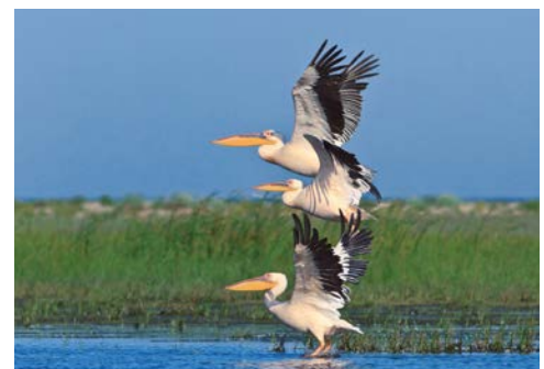
Pelikane am Donaudelta

Die Donau teilt sich in drei Mündungsarme, die ein wunderschönes Delta bilden, welches auf der Fläche