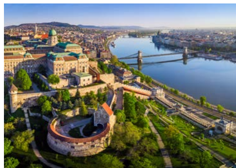
Budapest – die „Königin der Donau“

Wer mag, unternimmt einen Ausflug nach Osijek. Die viertgrößte Stadt Kroatiens liegt an dem Fluss Drau. Der Hafen befindet sich an der über 3,5 km langen Promenade, welche zu den längsten des Landes gehört. Die Stadt setzt sich aus der Festung, der Oberstadt und der Unterstadt zusammen. Jeder Bereich hat sehenswerte Gebäude zu bieten. Das Stadtbild ist allgemein von einer Vielzahl gotischer Bauwerke geprägt und lässt nicht nur das Herz von Architektur-Liebhabern höherschlagen.