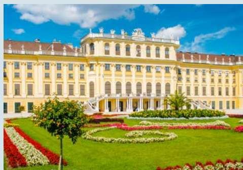
Schloss Schönbrunn in Wien