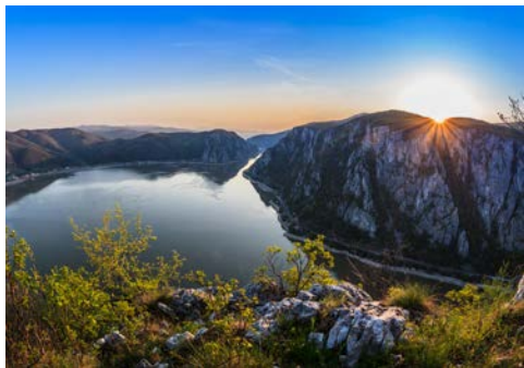
Die Donaukatarakten sind einmalig

Wer mag, fährt heute mit dem Bus durch das ländliche Rumänien bis nach Bukarest. Großzügige Alleen und imposante Bauwerke, wie z.B. der Triumphbogen, geben Bukarest ein gewisses „französisches Flair“, welches der rumänischen Metropole den Beinamen „Klein-Paris des Ostens“ eingebracht hat. Sozialistische Bauten thronen neben der ursprünglichen Altstadt, der sogenannten Lipskan. Der „Palast des Volkes“, geplant von Diktator Ceausescu, zieht alle Blicke auf sich. Ein ganzes Stadtviertel musste diesem gigantische Gebäude weichen, um alle Straßen und Blicke in der Stadt direkt auf den Palast zu zentrieren.