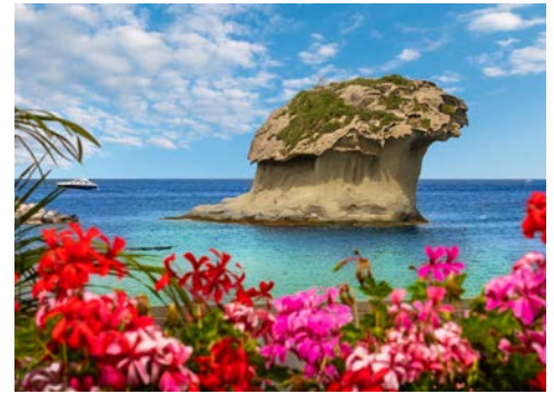
„Der Pilz“ vor Lacco Ameno

Frühstück im Hotel. Am Vormittag werden Sie vom Hotel abgeholt und bis Ischia Ponte gefahren. Bei einem Spaziergang werden Sie den antiken „Borgo“ von Ischia Ponte mit seinen bunten Fischerhäusern, den beeindruckenden Herrenhäusern und den schönen Kirchen besichtigen. Früher hieß Ischia Ponte auch „Borgo di Gelsa“, wegen der zahlreichen Maulbeerbäumen (Gelsi auf italienisch), welche wichtig für die Seidenraupenzucht sind. Im Laufe der Zeit blieb die Struktur des Dorfes mit engen Gassen, noblen Palästen und charakteristischen niedrigen Häusern unverändert. In einer dieser Gassen ist es möglich, die alte Boccia-Bäckerei zu besuchen, die seit etwa 70 Jahren mit ihrem Holzofen Brot nach alten Rezepten herstellt. Unter den vielen Kirchen sticht die Kathedrale Maria Himmelfahrt hervor. In der Krypta, die mit Fresken der Schule von Giotto geschmückt ist, sind immer noch die Gräber der Adelfamilien der Insel erhalten. Der Hafen Ischia Ponte blieb auch nach der Eröffnung des Bourbon-Hafens für lange Zeit der Favorit der Ischitaner. Abendessen und Übernachtung.