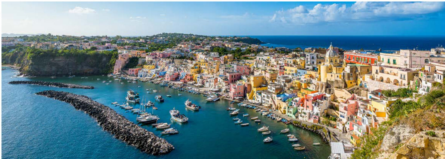
Einfach bezaubernd – der Blick auf Procida