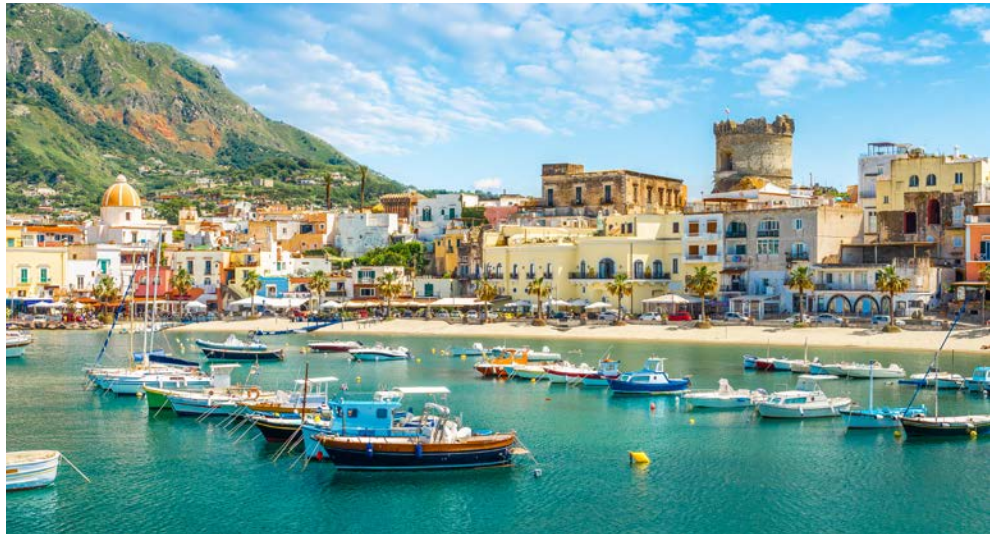
Hafen von Forio

Ischia ist mit rund 67.000 Einwohnern die größte Insel im Golf von Neapel, sowie Hauptinsel der sogenannten Phlegräischen Inseln. Zu den herausragenden Sehenswürdigkeiten gehört das knapp vor der Küste liegende Castello Aragonese mit dem pittoresken Garten. Ischia ist auch für seine zahlreichen Heilbäder berühmt, die von mehreren heißen Quellen vulkanischen Ursprungs gespeist werden. Bei einem Aufenthalt auf Ischia ist ein Besuch des historischen Zentrums, dessen lange Geschichte bis zu den Epochen weit vor Christus zurückgeht, ein absolutes Muss. Eine Vielzahl von Gassen, Handwerksläden, Geschäften, Buchhandlungen und Kunstgalerien, Cafés, Weinstuben und Restaurants geben außerdem einen Anreiz zur Erkundung.