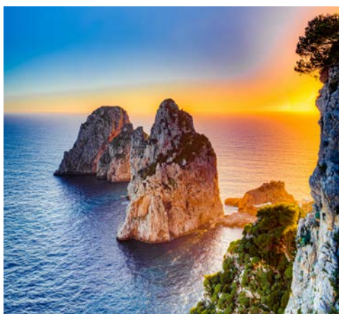
Capri – die Felsformation „I Faraglioni“ (Leuchtturm)