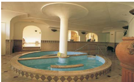
Terme mit Wellnessbereich