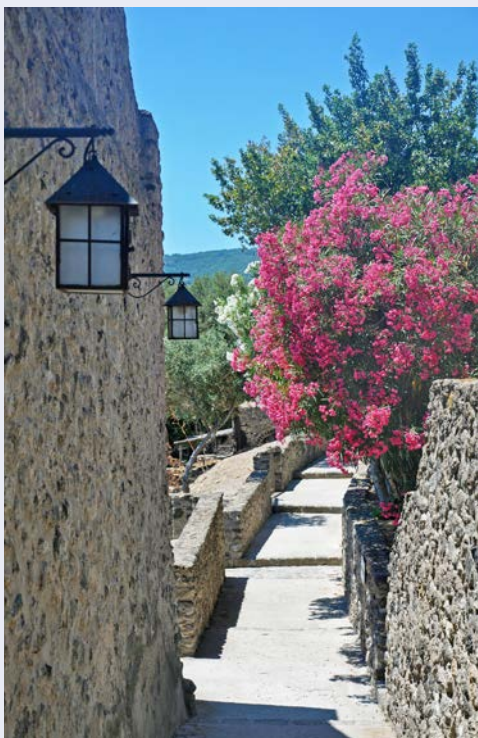
Wunderschön – Gasse in Sant' Angelo