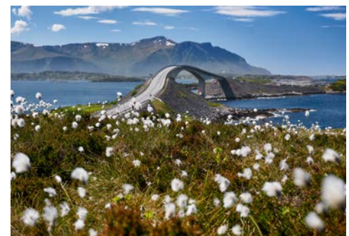
Die Atlantik-Straße verbindet Molde und Kristiansund