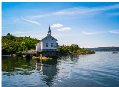
Idylle im Oslofjord