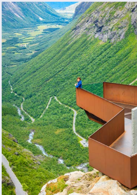
Blick vom Trollstigen

Der erste Höhepunkt des Tages ist die pittoreske Atlantik-Straße. Die wohl schönste Autostraße der Welt verbindet Molde und Kristiansund miteinander. Auf rund acht Kilometern haben Sie einen beeindruckenden Panoramablick auf das Meer, kommen Sie vorbei an bezaubernden Fischerdörfern und befahren beeindruckende Brücken. Nach der beeindruckenden Küstenstraße folgt mit dem Trollstigen die