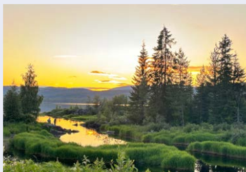
Mjøsa See im Schein der Mitternachtssonne