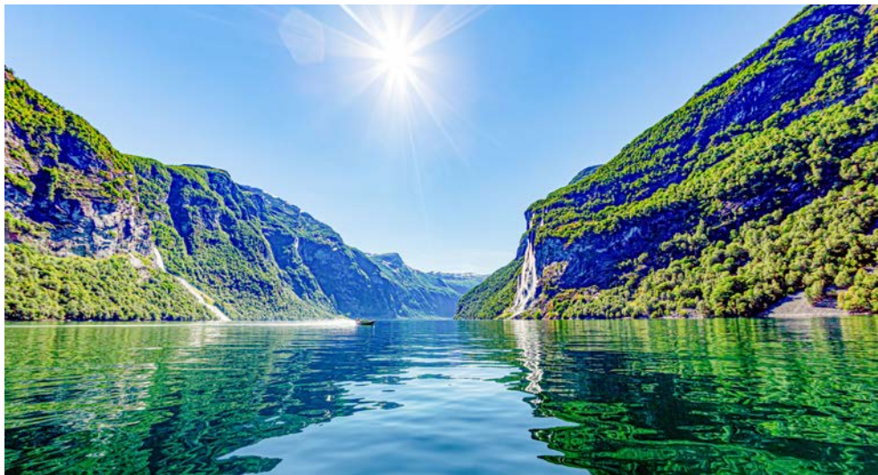
Der Geirangerfjord – der „König der Fjorde“