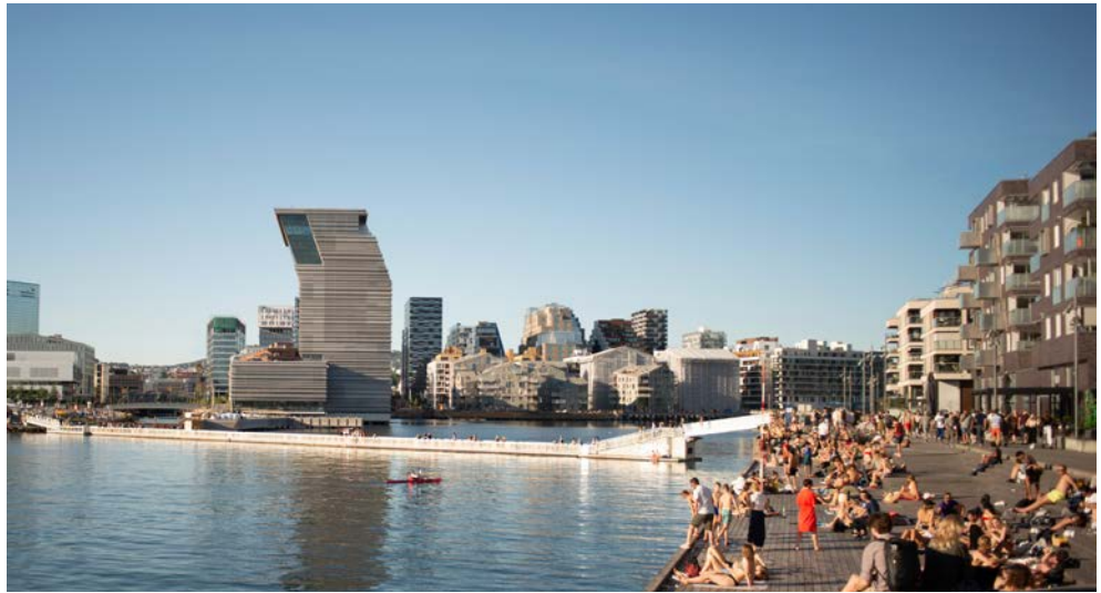
Die moderne Seite Oslos mit dem Munch-Museum

Erleben Sie den Zauber des Nordens – mit Trolle und Wikingern, Mythen und Legenden. Gemeinsam mit anderen Nordland-Begeisterten erleben Sie eine echte Traumreise. Norwegen fasziniert mit bizarren Bergwelten und tiefen Fjorden, Gletschern und schroffen Felsen, blühenden Wiesen und majestätischen Wasserfällen. Dazu kommen malerische Fischerdörfer und entspannte Städte. Diese Rundreise bietet Ihnen einen wunderbaren Mix aus Natur und Kultur. Im Sommer genießen Sie die Mitternachtssonne, die alles in ein besonderes und unwirkliches Licht taucht.