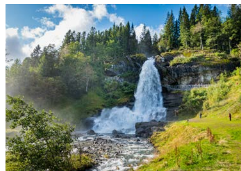
Unterwegs mit der Flåmbahn

Je nach Abflugzeit haben Sie noch etwas Freizeit in Oslo, bevor Sie Ihr Transferbus zurück zum Flughafen Oslo-Gardermoen bringt. Rückflug nach Deutschland.