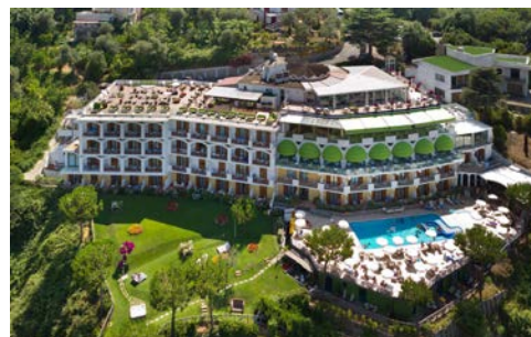
Blick auf Ihr Hotel

Genießen Sie eine atemberaubende Aussicht über Sorrent und den Golf von Neapel im Grand Hotel President (Landeskategorie: 4 Sterne). Dank seiner erhöhten Lage besticht das Hotel durch eben diese fantastische Aussicht sowie durch seine üppigen, mediterranen Gärten. Ihr Hotel liegt am Ende einer ruhigen, ebenen Privatstraße. Ihr Bus für die Ausflüge ist nur fußläufig (ca. 400 Meter) erreichbar. Der Shuttlebus des Hotels verkehrt mehrmals täglich ins Zentrum und zurück (alternativ ca. 20 Minuten Fußweg). Dieser startet und endet direkt vor dem Hotel. Zum Entspannen steht Ihnen der Swimmingpool mit Sonnenliegen zur Verfügung. Dieser ist i.d.R. von April bis Oktober geöffnet. Daneben können Sie den Spa-Bereich kostenpflichtig nutzen. Italienisch und international inspirierte Gerichte serviert Ihnen das Restaurantpersonal in einer idyllischen Atmosphäre mit Aussicht über die Bucht. Nach dem Essen verweilen Sie bei einem Getränk an der Loungebar. Elegant und einladend, im klassischen Stil und mit warmen Farben gestaltet, verfügen alle 110 Zimmer über Balkon oder Terrasse, über Free Wi-Fi, Direktwahltelefon, zentrale Klimaanlage, Minibar, Satelliten-TV mit Sky-Kanälen, elektronischen Safe, Haartrockner und WC mit Dusche oder Badewanne. Hinweis: Zimmer ohne Meerblick können in den unteren Etagen des Hotels mit Blick zum Hang liegen.