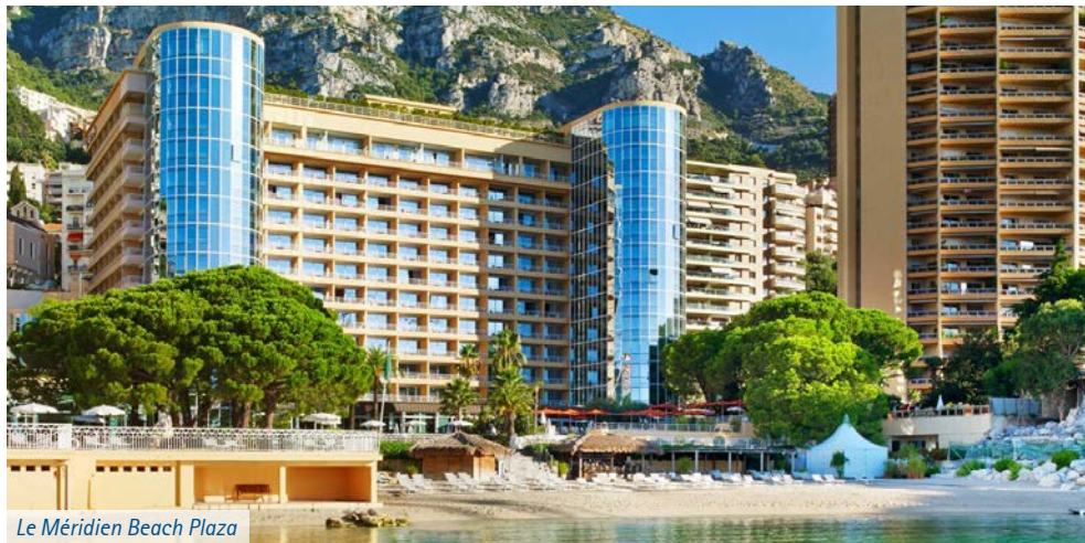
Le Méridien Beach Plaza

Das Le Méridien Beach Plaza (Landeskategorie: 4-Sterne) befindet sich in idealer Lage nur einen Fußmarsch von Monacos berühmten Sehenswürdigkeiten entfernt, darunter das Monte Carlo Casino, das Grimaldi Forum, der beeindruckende Prinzenpalast, Port Hercule und die Altstadt. Das Le Méridien Beach Plaza bietet schier endlose Möglich- keiten, um sich zu vergnügen: weitläufige eigene Terrassen, prachtvolle Innen- und Außenpools, hervorragende Fitness- einrichtungen und einen großen Sandstrand – der einzige Privatstrand in Monte Carlo. Alle Zimmer sind Nichtraucher- zimmer, modern und mit allen Annehmlichkeiten aus- gestattet. Die Zimmer der Kategorie „Classic“ sind ca. 22-26