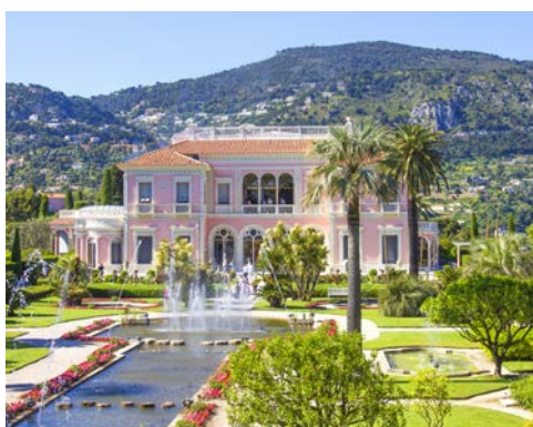
Die Villa Rothschild