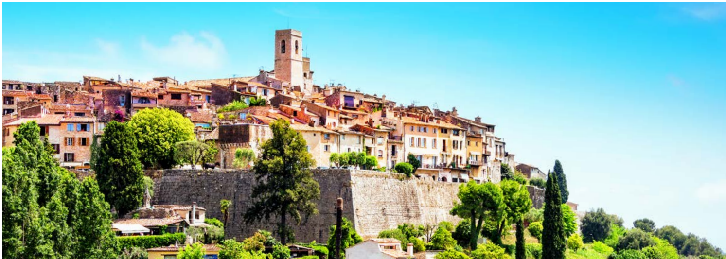
Saint Paul de Vence