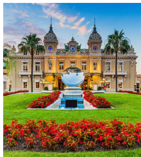
Das berühmte Spielcasino in Monte Carlo