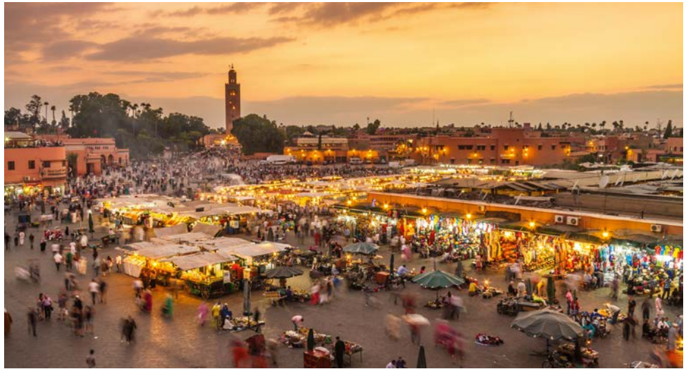
Der Jemaa el Fna in Marrakesch

Willkommen in einer orientalischen Märchenwelt. Farbenprächtige Märkte voller Gewürzdüfte, ein Labyrinth verwinkelter Gassen in den Medinas, Schlangenbeschwörer und Wasserverkäufer auf dem Platz der Gaukler in Marrakesch entführen Sie in die Welt von 1001 Nacht. Berber, Araber und Europäer prägten das Land. Marokko fasziniert durch verschiedenste Landschaftsformen mit grandiosen Lichtspielen. Den schneebedeckten Gipfeln des Hohen Atlas schließen sich Sanddünen der westlichen Sahara an. Wer Marokko be-reist, vergisst für eine Weile, dass er im 21. Jahrhundert lebt.