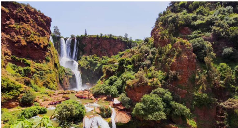
Die Wasserfälle von Ouzoud