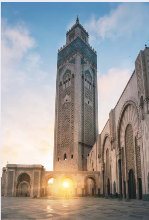
Moschee in Casablanca

Die Tagesetappe führt durch die schönen Landschaften des Mittleren Atlas mit reizvollen Bergdörfern wie Ifrane oder Azrou und durch die fruchtbare Tadla-Ebene zur Festung Kasbah Tadla