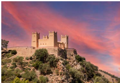
Die Festung Kashba

In südöstlicher Richtung fahren Sie weiter zur Talssperre Bin El Ouidane, von wo aus Sie einen wunderschönen Panoramablick haben, und weiter zu den Wasserfällen von Ouzoud. Über 100 m stürzen die Wassermassen hier in die Tiefe. Am Nachmittag erreichen Sie schließlich Marrakesch. Abendessen und Übernachtung in Marrakesch.