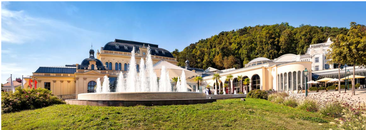
Kurpark Baden bei Wien