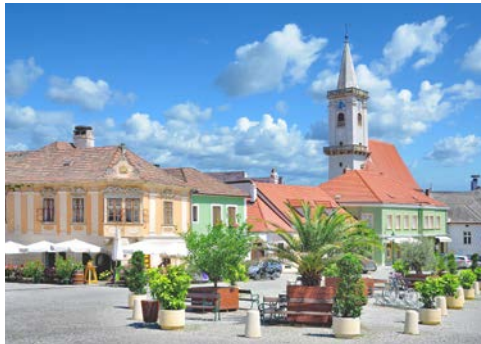
Rust am Neusiedler See

Der heutige Ausflug entführt Sie in das östlichste Bundesland Österreichs – das Burgenland. Erster Stopp ist die Hauptstadt Eisenstadt, wo Sie das berühmte Barockschloss Esterházy besichtigen. In Rust am Neusiedlersee fahren Sie mit einem kleinen „Pusztazug“ entlang der schönen Weingärten und erkunden ein Bauernhaus mit Originalmöbeln aus den 1900er Jahren. In Mörbisch, einem kleinen idyllischen