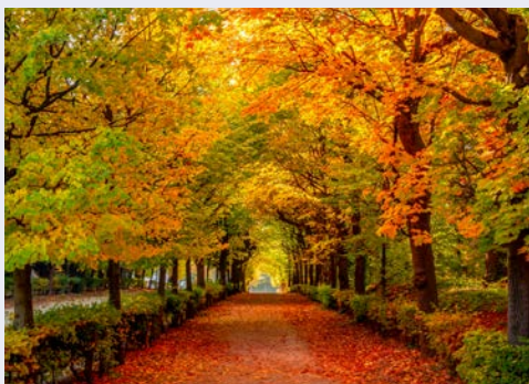
Laubfärbung im Park Schönbrunn