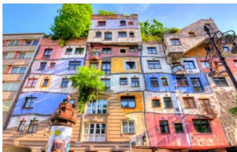
Fassade des Hundertwasser-Hauses

Bevor es heute auf die Heimreise geht, besuchen Sie noch einen ganz besonderen Ort in Wien: den Wiener Zentralfriedhof. Man sagt den WienerInnen ein besonderes Verhältnis zum Tod nach. „Die schöne Leich“ ist nicht nur ein aufwendiges Leichenbegräbnis, sondern auch Ausdruck einer Lebenshaltung: Der Tod ist unvermeidlich – also feiern wir ihn. Klingt im ersten Moment ungewohnt, doch ist handelt es sich beim Zentralfriedhof nicht einfach nur um einen Friedhof wie man vermuten mag. Er ist die bedeutendste Begräbnisstätte Wiens. Er vereint alle Religionen und Konfessionen und ist mit einer Größe von rund 2,5 km 2 der flächenmäßig zweitgrößte Friedhof Europas. Geschätzte drei Millionen Menschen haben hier Ihre letzte Ruhe gefunden. Die Friedhofskirche „Zum Heiligen Karl Borromäus“ (im Volksmund Lueger Kirche genannt) wurde nach Plänen des Architekten Max Hegele errichtet – neben Otto Wagners Kirche am Steinhof der bedeutendste Kirchenbau des Jugendstils. Zahlreiche berühmte Persönlichkeiten