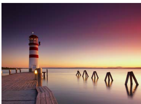
Am Neusiedler See

Heute Vormittag werden Sie in der Konditorei Niemetz zum „Schwedenbomben-Workshop“ erwartet. Weiterfahrt zu Europas größtem unterirdischen See, der Seegrotte, die Sie auch per Boot erkunden. Danach unternehmen Sie einen Ausflug in den Wienerwald. Zunächst besichtigen Sie das Zisterzienserkloster Heiligenkreuz mit dem mittelalterlichen Kreuzgang und der Grabstätte des letzten Babenbergers. Ein kurzer Spaziergang durch die Römer- und Thermalstadt Baden rundet das Programm ab. Hier besteht ebenfalls die Möglichkeit der individuellen Kaffeepause. Der Abend steht Ihnen dann in Wien zur freien Verfügung.