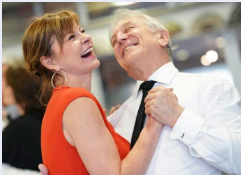
Viel Vergnügen bei Ihrem Tanzkurs

Dieser Tag steht Ihnen für eigene Erkundungen zur freien Verfügung.