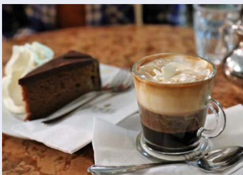
Typisch – ein Stück Sachertorte und eine Melange