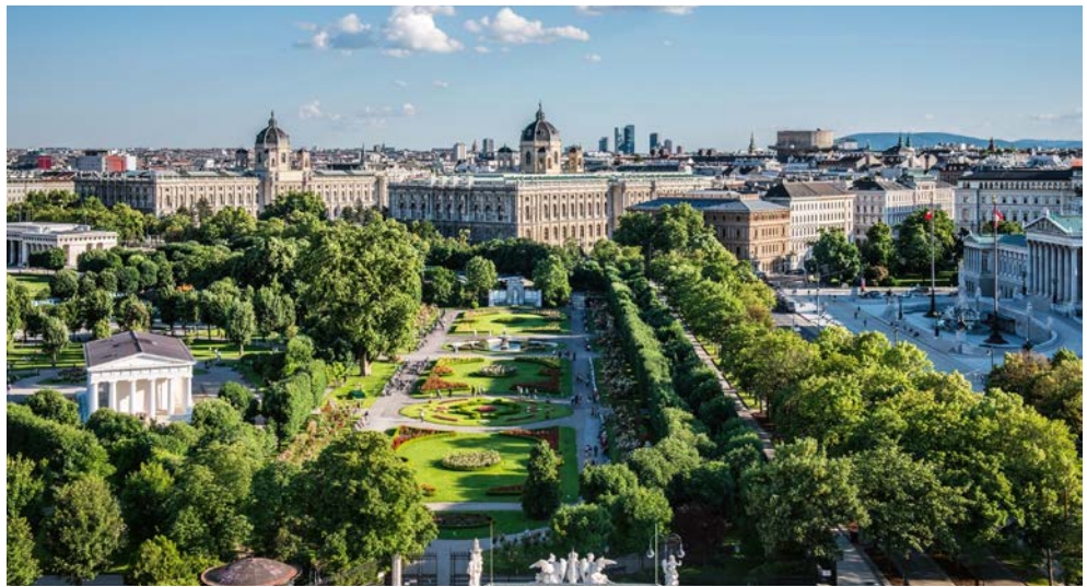
Grüne Oase inmitten der Stadt – der Volkspark

Genießen Sie unvergessliche Tage in der charman- ten Hauptstadt Österreichs mit einer Gruppe von gleichgesinnten Alleinreisenden. Begeben Sie sich auf die Spuren des prächtigen imperialen Erbes, freuen Sie sich auf die Prachtbauten der Ring- straße – Staatsoper, Hofburg, Parlament ... Kaise- rin Elisabeth wird Ihnen im Sisi-Museum und bei der Besichtigung von Schloss Schönbrunn „be- gegnen“. Ein Glaserl Wein am Abend im Heurigen- lokal, um am nächsten Tag ins UNESCO-Welterbe „Burgenland“ aufzubrechen. Hier erwarten Sie das berühmte Barockschloss Esterházy, ein „Pusztazug“ entlang der schönen Weingärten und eine unter- haltssame Ausflugsfahrt auf dem Neusiedlersee. Der Wienerwald und die Thermalstadt Baden sowie der Zentralfriedhof mit den Ruhestätten von Lud- wig van Beethoven, Wolfgang Amadeus Mozart, Josef Strauss und vielen anderen bedeutenden Persönlichkeiten stehen ebenfalls auf Ihrem in- kludierten Ausflugsprogramm. Und natürlich darf in der Walzerstadt Wien ein kleiner Tanzkurs nicht fehlen!