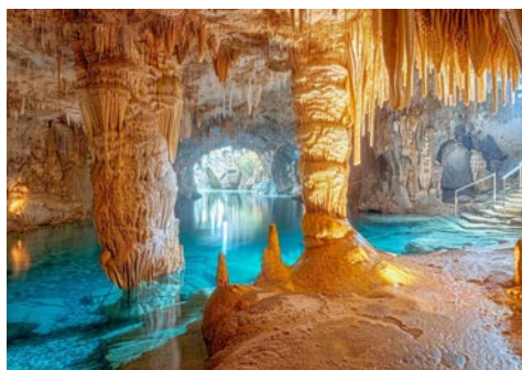
Höhlen von Porto Cristo

Lernen Sie die Kontraste der bezaubernden Inselmetropole kennen. Palma de Mallorca, die Hauptstadt der Balearen, zählt zu den schönsten Städten des Mittelmeeres. Mit ca. 425.000 Einwohnern lebt hier die Hälfte der Gesamtbevölkerung Mallorcas. Lassen Sie sich von der Lage der „La Ciutat“ (die Stadt) an einer der herrlichsten und, mit 20 km Länge, einer der großzügigsten Buchten des Mittelmeerraumes beeindrucken. Ein geführter Stadtrundgang durch die Altstadtgassen mit ihren sehenswerten, historischen Bauwerken und Innenhöfen, ein Besuch der berühmten Kathedrale und die anschließende