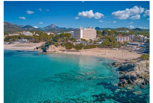
Fantastisch gelegen – Ihr Hotel

Das Buffetrestaurant im Universal Lido Park bietet Ihnen abends Themenabendessen und am Freitag genießen Sie ein Galadinner. Zum Speisen bietet sich auch die Terrasse mit ihrer wunderbaren Aussicht auf das Meer an.