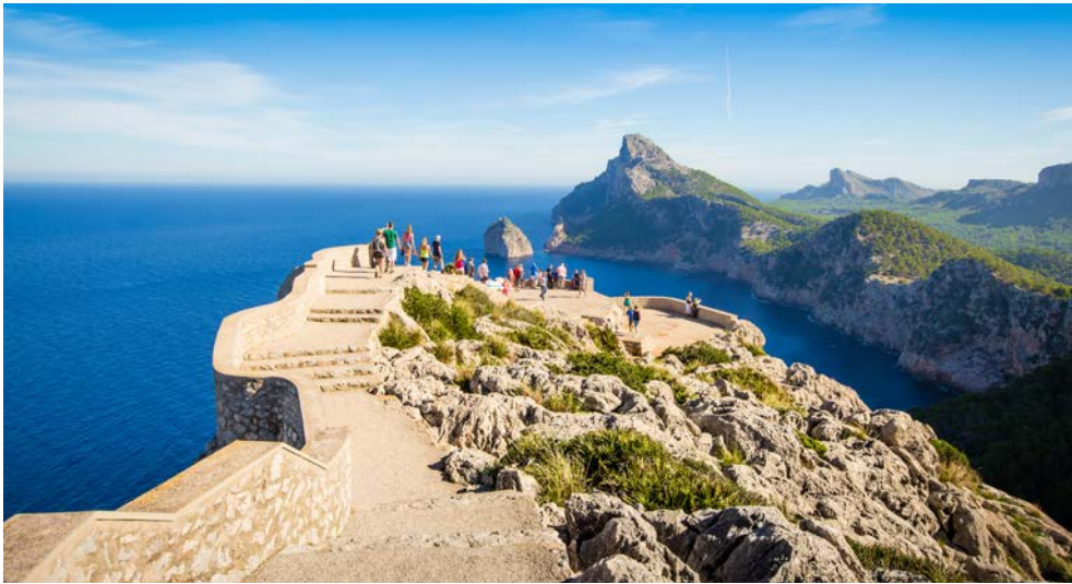
Blick zum Kap Formentor