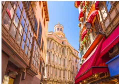
Palma de Mallorca, Altstadt

Am Flughafen werden Sie von Ihrer örtlichen, Deutsch sprechenden Reiseleitung willkommen heißen und es erfolgt der Transfer zu Ihrem Hotel.