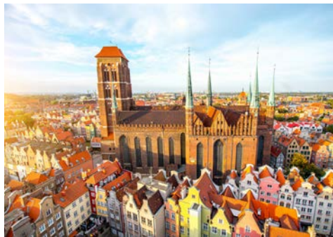
Marienkirche in Danzig

23.03.-28.03.2025 13.04.-18.04.2025 04.05.-09.05.2025 25.05.-30.05.2025 31.08.-05.09.2025 07.09.-12.09.2025 05.10.-10.10.2025