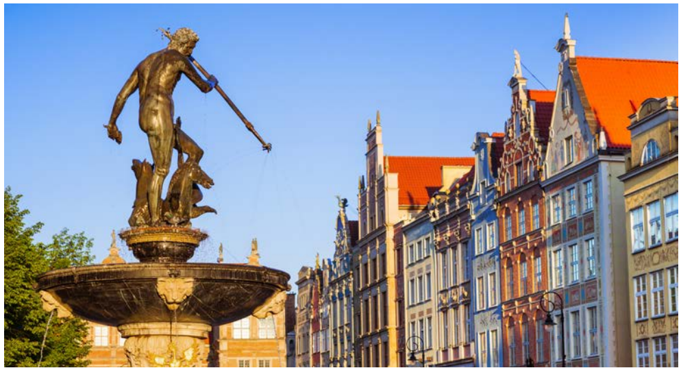
Der Neptunbrunnen in der Altstadt von Danzig

Die Umgebung erkunden Sie ebenfalls auf inkludierten Ausflügen mit Malbork und der berühmten Marienburg sowie der Kaschubischen Schweiz. Erleben Sie Danzig – die Stadt an der Mottlau und ihre faszinierende Umgebung!