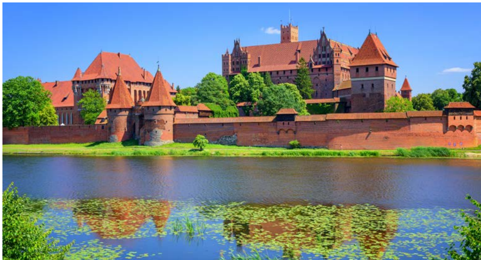
Besichtigen Sie den größten Backsteinbau der Welt, die Marienburg!