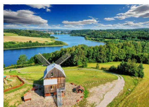
Idylle in der Kaschubischen Schweiz

Nach dem Frühstück im Hotel erfolgt die Rückreise.