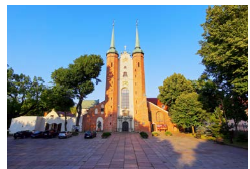
Die markanten Türme der Kathedrale in Danzig-Oliwa

Nach dem Frühstück bringt Sie der Bus zunächst nach Marienburg und Sie besuchen die größte mittelalterliche gotische Festung Europas. Die Museumsburg wurde nicht ohne Grund zum UNESCO-Weltkulturerbe ernannt. Die Marienburg ist majestätisch, rau und schön zugleich. Die aus dem 13. Jahrhundert stammende Hauptburg des Kreuzritterordens entstand infolge der Versetzung des Ordenssitzes aus Venedig. Umgeben ist sie von einem Ring hoher Wehrmauern mit Toren und Basteien. In der Vorburg befinden sich u.a. die Waffenkammer und die Laurentius-Kapelle. Die Mittelburg mit dem großen Hof entstand im 14. Jh.. Der Ostflügel birgt Gästezimmer mit gotischem Gewölbe, den Rittersaal