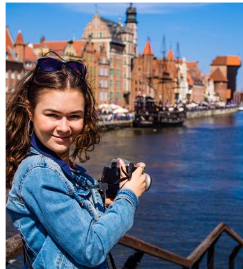
Fotomotive gibt es viele tolle

und das ehemalige Hospital. Zu den interessantesten Burggemächern der Hochburg gehören der Kapitelsaal, die Schatzkammer, drei Kapellen und die Schlafkammern. Die im 13. Jh. erbaute Hochburg erreicht man über die Zugbrücke. In der Mitte des Innenhofs befindet sich ein 18 m tiefer Brunnen, der während der Belagerung genutzt wurde. In den Wehrmauern ist das Burgmuseum untergebracht mit Sammlungen zur Geschichte der Burg, mittelalterlichen Skulpturen und Keramik. Die Kunstabteilung verfügt über wertvolle Exponate des Kunsthandwerks.