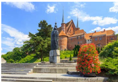
Kathedrale von Frauenburg mit Statue von Kopernikus

Danach geht es weiter nach Frauenburg am Frischen Haff, wo der Astronom Nikolaus Kopernikus sein längstes Domizil (1512-43) hatte und auch begraben wurde. Sie besuchen die berühmte Kathedrale, die zu den bedeutendsten Bauten der Backsteingotik gehört. In der Anlage steht der Turm, in dem Kopernikus angeblich sein Hauptwerk „Über die Bewegung der Himmelskörper“ verfasste, wonach die Gestirne sich nicht um die Erde, sondern um die Sonne drehen. Genießen Sie von der Aussichtsplattform einen