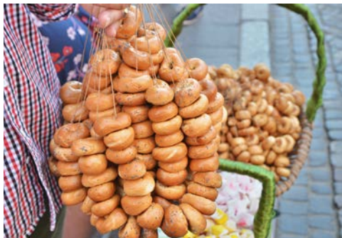
Wussten Sie, dass „Bagels“ ursprünglich aus Polen sind?

und das ehemalige Hospital. Zu den interessantesten Burggemächern der Hochburg gehören der Kapitelsaal, die Schatzkammer, drei Kapellen und die Schlafkammern. Die im 13. Jh. erbaute Hochburg erreicht man über die Zugbrücke. In der Mitte des Innenhofs befindet sich ein 18 m tiefer Brunnen, der während der Belagerung genutzt wurde. In den Wehrmauern ist das Burgmuseum untergebracht mit Sammlungen zur Geschichte der Burg, mittelalterlichen Skulpturen und Keramik. Die Kunstabteilung verfügt über wertvolle Exponate des Kunsthandwerks.