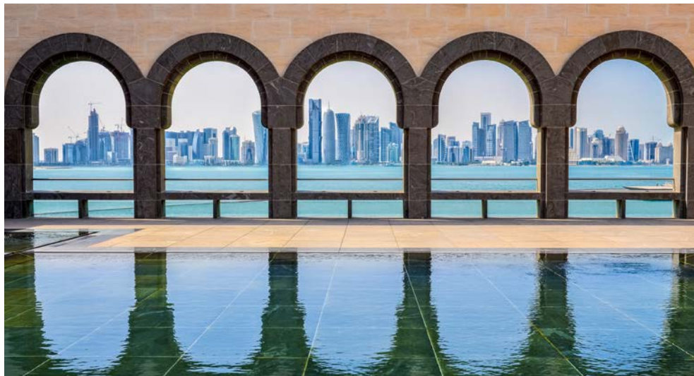
Doha – Tradition und Moderne