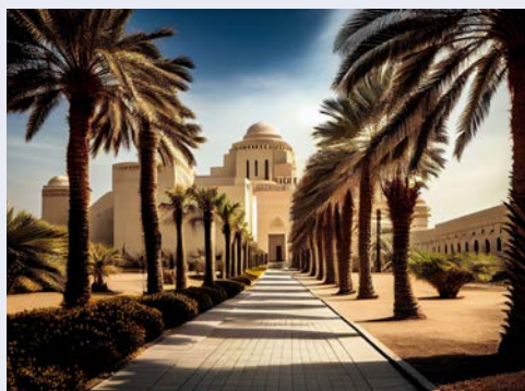
Museum für islamische Kunst in Doha