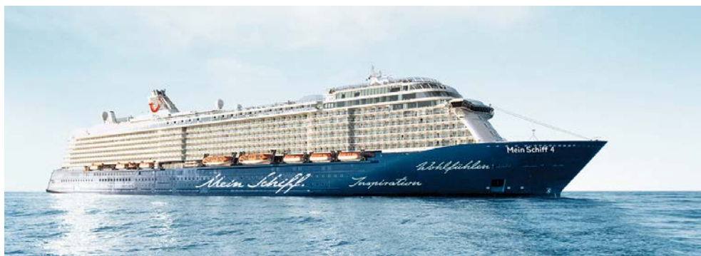
Willkommen auf der Mein Schiff 4

Vor wenigen Jahrzehnten waren hölzerne Fischerboote noch das übliche Fortbewegungsmittel der Region. Heute sind es Limousinen und Privatjets. Mit den Ölfunden in den 1960er-Jahren kam unermesslicher Reichtum nach Abu Dhabi und verwandelte es in eine futuristische Metropole. Schauen Sie sich um: