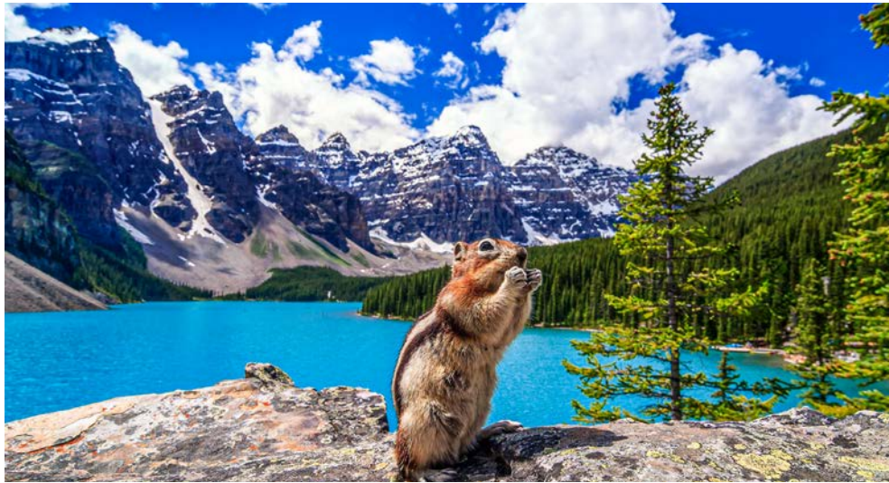
Erleben Sie einzigartige Nationalparks