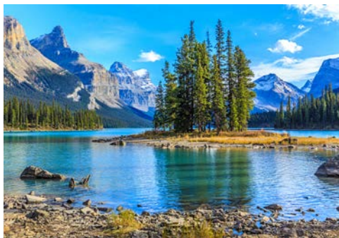
Der Jasper Nationalpark

Genießen Sie die Fahrt auf einer der schönsten Panoramastraßen der Welt, dem Icefield Parkway. Er verbindet die beiden Nationalparks Banff und Jasper. Entlang der Route liegen wunderschöne Gebirgsseen und bis zu 3.000 m hohe Gipfel. Eines der größten Gletscherfelder in den Rocky Mountains, der mächtige Athabasca-Gletscher, kommt fast bis an die Straße heran. Mit riesigen, allradbetriebenen Fahrzeugen unternehmen Sie eine Tour über den Gletscher. Am Nachmittag erreichen Sie Ihre Hotel.