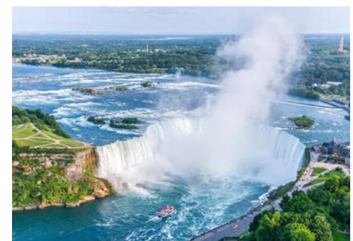
Entdecken Sie die Niagara-Fälle hautnah

kennen. In der City finden sich ausgedehnte Park- und Grünanlagen. Sie besuchen das imposante neugotische Parlamentsgebäude mit seinem 92 m hohen Peace Tower. Am Morgen fahren Sie zunächst in das Gebiet der Thousand Islands. Hier am Abfluss des St. Lawrence in den Ontario-See liegen unzählige kleine Inseln. Sie unternehmen eine Bootsfahrt bevor Sie entlang des Ontario-Sees nach Toronto weiterfahren. Übernachtung in Toronto.