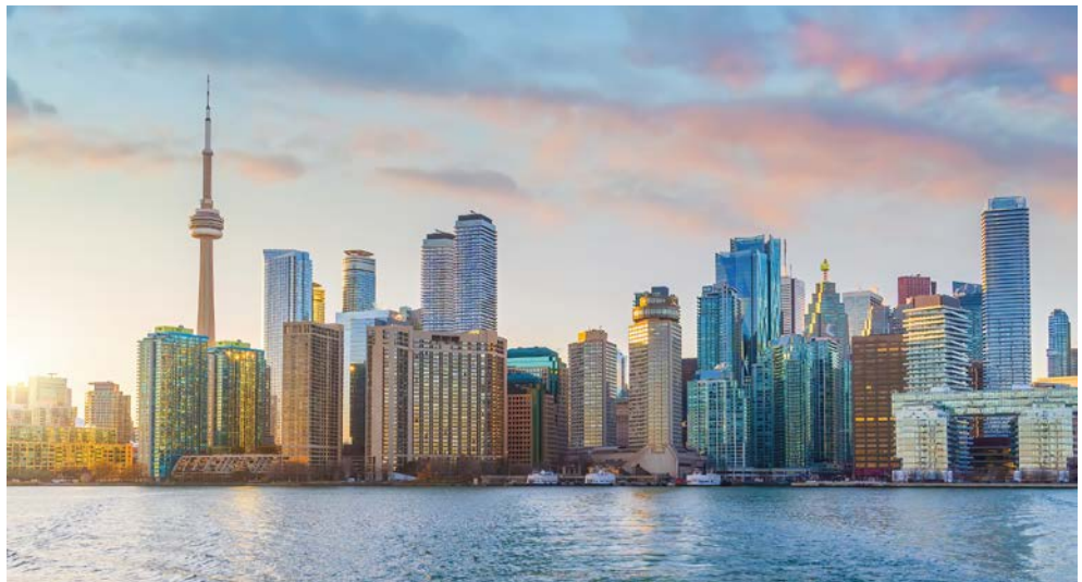
Willkommen in Toronto

Der Osten Kanadas beeindruckt mit seinen unendlichen Weiten, stillen Seen und nicht enden wollenden Wäldern. Daneben gilt es die großen Städte zu erkunden. Toronto, die moderne Metropole am Ontario-See, die Bundeshauptstadt Ottawa, Montreal und Québec, die beiden französisch geprägten Städte am St. Lawrence. Ein Muss für den Besucher ist natürlich auch das Naturschauspiel der Niagara-Fälle. Im Anschluss setzen Sie Ihre Reise fort um auch den spannenden Westen des Landes zu erkunden. Sie fliegen nach Calgary, der Cowboy-Stadt inmitten weiter Prärien in der Provinz Alberta. Von hier führt Sie die Reise in die Nationalparks der Rocky Mountains mit ihren beeindruckenden Gebirgsmassiven, Gebirgsseen und Gletschern. Ihre Reise endet in Vancouver. Die einzigartige Lage am Pazifik, umrahmt von Fjorden und Bergen, macht Vancouver zu einer der schönsten Städte der Welt.