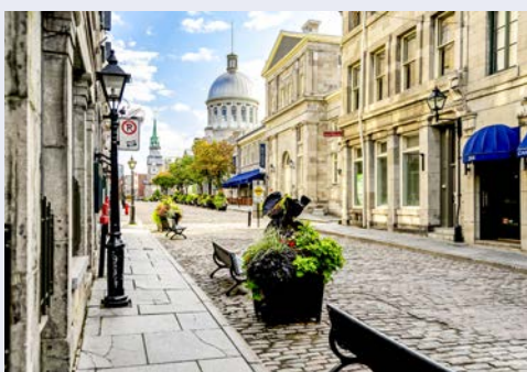
Das wunderschöne Montreal

Heute fliegen Sie in den Westen des Landes nach Calgary, einer herrlich gelegenen Stadt in den Kanadischen Rockies. Begrüßung durch Ihre neue, örtliche Reiseleitung und Fahrt zu Ihrem Hotel in Banff.