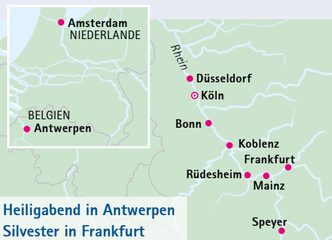
Heiligabend in Antwerpen Silvester in Frankfurt

Einzelkabinen ab € 1.323,- (22.12.), ab € 2.431,- (27.12.) bzw. ab € 3.395,- (Kombi) auf Anfrage, begrenztes Kontingent. Es gelten die A-ROSA Premium alles inklusive Bedingungen. Die Sonderpreise gelten für ein limitiertes Kontingent. *mit Zusatzbett. *Ersparnis beim Kabinenpreis im Vergleich zum Katalogpreis.