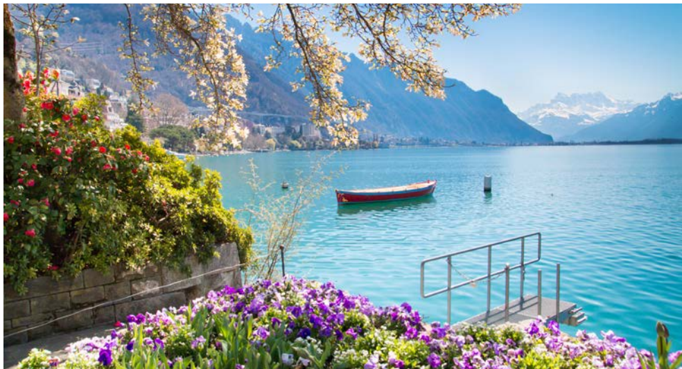
Willkommen in Montreux