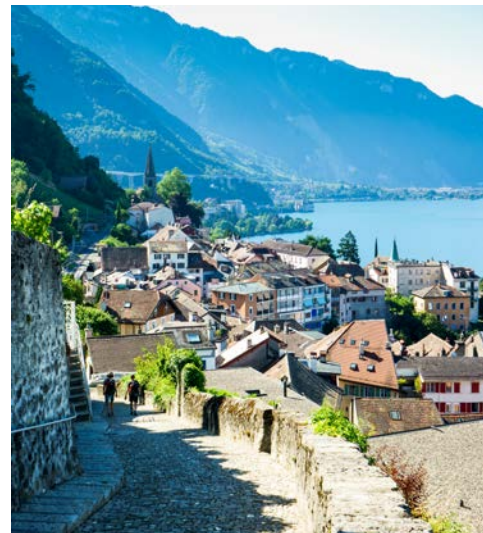
Montreux abseits der mondänen Uferpromenade