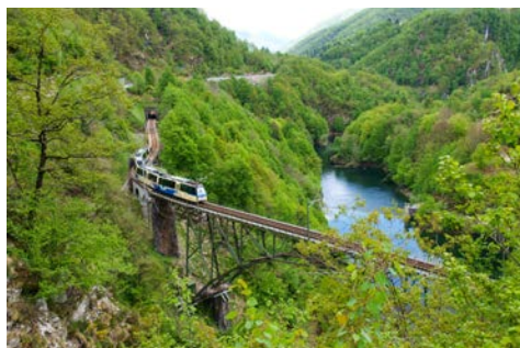
„Centovalli“ bedeutet hundert Täler

typischen Lokale und Bars, wo Sie unter anderem ein Glas Turiner Wermut genießen können.