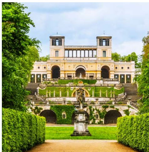
Orangerie im Park Sanssouci

Nach dem Frühstück werden Sie um 9 Uhr abgeholt und fahren gemeinsam nach Petzow in die wunderschöne, wald- und wasserreiche Umgebung des Havellandes. Hier spazieren Sie durch den Petzower Schlossgarten, ein wiederbelebtes Brandenburger