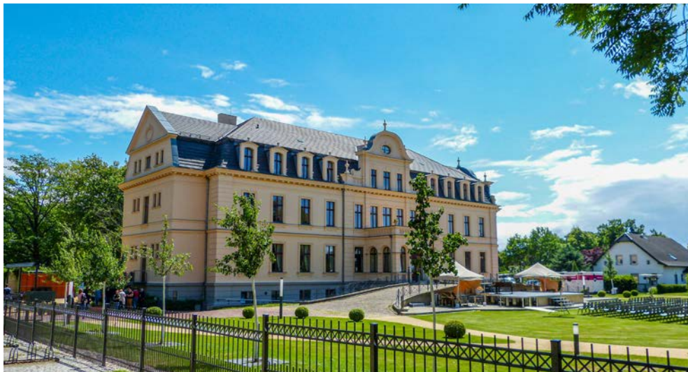
Schloss Ribbeck mit dem berühmten Birnbaumgarten