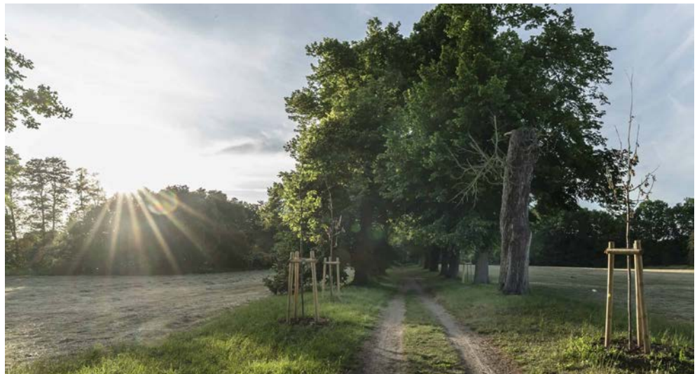
Wanderweg nahe des Hotels