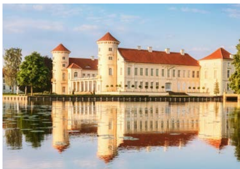
Das Rheinsberger Schloss am Ufer des Grienericksees

Nach dem Frühstück werden Sie um 9 Uhr abgeholt und besuchen das Preußen Museum in Wustrau, welches interessante Einblicke in die Licht- und Schattenseiten der preußischen Geschichte wirft. Weiter geht es in die Geburtsstadt von Theodor Fontane, dessen Spuren Sie hier auf Schritt und Tritt begleiten werden. Die Stadt ist eine echte Perle Brandenburgs. Die historische Altstadt, ein zweihundert Jahre altes Gesamtkunstwerk des Frühklassizismus, macht den Geburtsort Theodor Fontanes und Karl-Friedrich Schinkels zum Musterbeispiel preußischer Baukunst. Lange und breite Straßen mit stattlichen Plätzen bestimmen das Bild. Bei einem Gang durch die bezaubernde Altstadt kommen Sie an Sehenswürdigkeiten wie dem Geburtshaus, dem Denkmal und der Klosterkirche St. Trinitatis vorbei. Sie besichtigen die Konzertkirche und den Garten des Kronprinzen Friedrich, den sogenannten Tempelgarten. Die Siechenstraße gehört zu den wenigen Gassen, welche die große Feuersbrunst von 1787 verschont hat und vermittelt einen malerischen Eindruck vom „alten Neuruppin“.