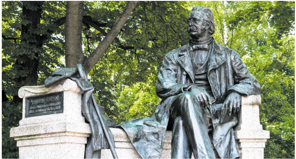
Fontane Denkmal in Neuruppin