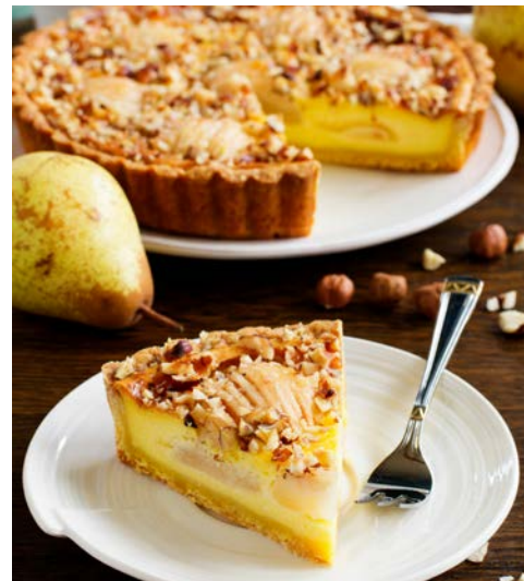
Kaffeepause mit Birnenkuchen

Nach Frühstück und Check-Out treten Sie Ihre Heimreise an.