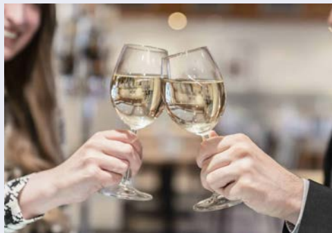
Stoßen Sie auf eine erlebnisreiche Zeit an