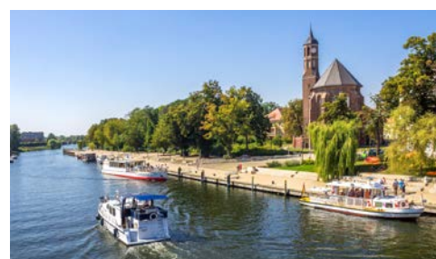
Brandenburg a.d. Havel