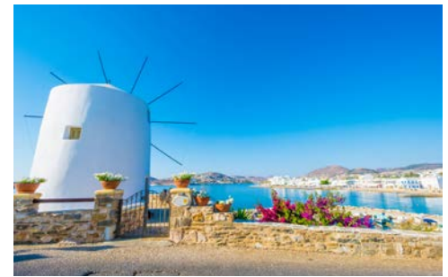
Beliebter Treffpunkt auf Paros – die Windmühle am Hafen

Ihre Reise beginnt mit dem Flug nach Santorin. Die einzigartige vulkanische Landschaft der griechischen Insel Santorin ist ein ganz besonderes Ziel. Schwarzrote Strände und kleine, verschlafene Orte, die sich in 300 m Höhe an einen Fels hang schmiegen, prägen das Bild der Insel. Am Flughafen werden Sie von Ihrer örtlichen, Deutsch sprechenden Reiseleitung empfangen und zu Ihrem Hotel begleitet. Abendessen in einer Taverne. (A)