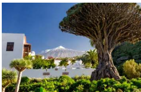
Blick auf den Teide

Nach der Ausschiffung erfolgt der Transfer und der Rückflug zum gebuchten Flughafen.