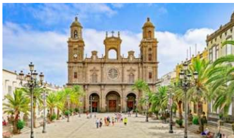
Kathedrale Santa Ana in Las Palmas

Bereits im Jahre 1970 entstanden die Pläne des Gartens, doch erst neunzehn Jahre später konnte er ihn endlich im Auftrag der Inselregierung realisieren. Im Norden der Insel hat er in einem einzigartigen, zusammenhängenden Höhlensystem vulkanischen Ursprungs, den Jameos del Agua, ein Zentrum für Kunst und Kultur geschaffen. Kernstück dieser unterirdischen Anlage ist ein Konzertsaal mit etwa 600 Sitzplätzen. Warum machen Sie sich nicht ein Bild von Manriques fantasievollen Kunstwerken, die sich harmonisch in die Natur einfügen?