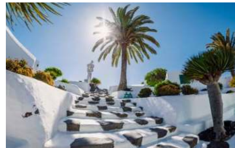
Museo del Campesino auf Lanzarote

Was für eine Insel der Gegensätze! Kilometerlange, weißsandige Strände, voller farbenfroher Tupfer von jenen. Das Surferparadies Fuerteventura wird Sie mit vielen verschiedenen Facetten begeistern. Dementsprechend ist auch das vom Passatwind geschliffene, sandfarbene Hügelland im Inneren der Insel geprägt von weiß getünchten Windmühlen und uralten, aber intakten Wasserschöpfprädern, die der kargen Wüstenlandschaft immer wieder grüne Oasen voll überbordender Fruchtbarkeit abtrotzen. Entdecken Sie die Insel für sich und probieren Sie unbedingt den typischen Käse und ein Glas Sangria.