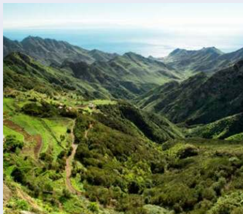
Anagabirge auf Teneriffa