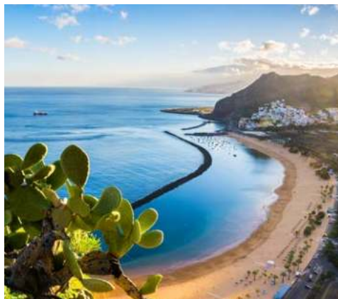
Palmenstrand Las Teresitas