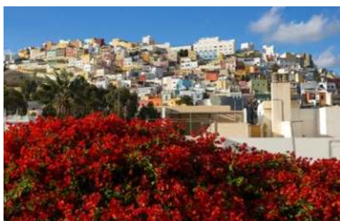
Wunderschönes Las Palmas

Von allen Urlaubsfreuden etwas, das bietet Ihnen die kreisrunde und wohl bekannteste Kanareninsel Gran Canaria. Den Westen der Insel kennzeichnen hohe Gebirge und tiefe Canyons. Sehenswert ist auch die Hauptstadt Las Palmas, die mit Einkaufsstraßen, Stadtparks und historischen Bauwerken schon immer eine kulturelle Brücke zum europäischen Festland war. Die über die Insel hinaus bekannte, vom Wind herbei gewehrte Miniwüste von Maspalomas sowie deren sonnenverwöhnte Dünenlandschaft und das strahlend blaue Wasser machen jedem Besucher klar: Gran Canaria, das ist ganzjährig herrliches, atlantisch erfrischendes Badevergnügen.