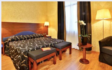
Beispiel – Doppelzimmer

Weitere Abflughäfen auf Anfrage ggf. gegen Gebühr möglich. Bitte beachten Sie: Für die Flüge und Bahnfahrten gilt: Umsteigeverbindungen möglich; Flüge in der Economy Class; Bahnfahrten mit Sitzplatzreservierung. Für die Bustransfers gilt: Bei Nichterreichen der Mindestteilnehmerzahl (sofern oben nicht anders genannt) von je 10 Personen pro genanntem Zustiegsort behalten wir uns eine alternative An- und Abreise vor; Umsteigeverbindungen möglich.