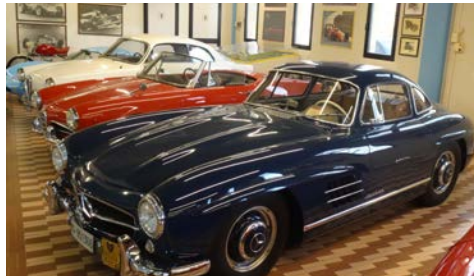
Umberto Panini Museum

im Ferrari € 150,- im Lamborghini € 200,-