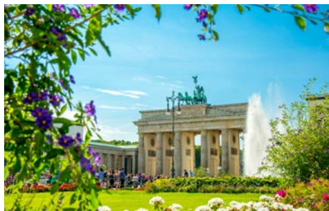
Willkommen in Berlin!

Nach dem Frühstück erfolgt die Ausschiffung.