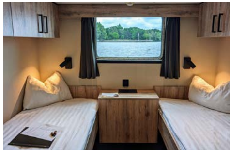
Kabinenbeispiel auf dem Hauptdeck

befindet sich die älteste betriebsfähige Schleuse Deutschlands.