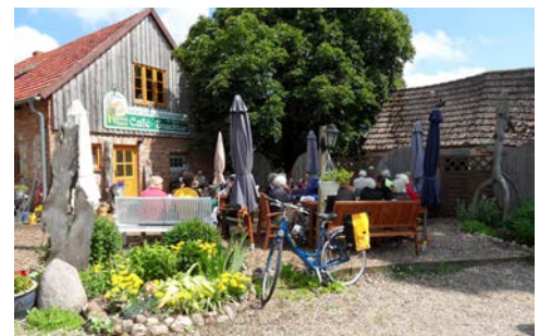
Eine kurze Pause zwischendurch

Heute steht die Insel Usedom auf dem Programm und Sie haben die Wahl zwischen 2 Radtouren. Nutzen Sie am Vormittag die Gelegenheit zu einem Besuch des Historisch-Technischen Museums im ehemaligen Kraftwerk oder planen Sie einen Besuch der Usedom Destillerie in Mölchow ( Tipp! ) ein. Bei schönem Wetter empfehlen wir die Radtour über Trassenheide und Karlshagen in Verbindung mit einem erfrischenden Bad in der Ostsee. Im Anschluss radeln Sie nach Zinnowitz, einem der bekanntesten und schönsten Ostseebäder Usedom. Zwischen Ostsee und Achterwasser ist der Ort umgeben von Buchen-, Eichen- und Nadelwald und der weiße, flach abfallende Sandstrand lädt zur Erholung ein.