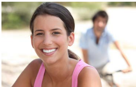
Mit netten Mitreisenden unterwegs

Morgens Schiffsfahrt von Schwedt nach Hohensaaten. Ihre heutige Radtour bringt Sie zunächst in Richtung Niederfinow und lädt ein zur Besichtigung des imposanten Schiffshebewerks – eine Begehung ist jederzeit möglich. Vorbei an kleinen Anhöhen, Lichtungen und Wäldern radeln Sie durch eine wunderschöne Landschaft – das letzte Stück auf dem Treidel-Fahrradweg am Finowkanal entlang – bis Eberswalde. Im Herzen der Stadt, im Finowkanal,