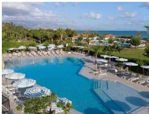
Grand Palladium Sicilia Resort & Spa

Das Hotel verfügt über ein Restaurant, Grill-Restaurant am Pool, Bars, Internetterminal, Whirlpool, Hallenbad, Friseur, Boutique, Lift sowie mehrere Pools mit Liegestühlen, Schirmen und Pooltüchern. Die 359 Zimmer sind modern mit Bad oder Dusche/WC, Haartrockner, Bademantel, Telefon, TV (ca. 2 deutschsprachige Programme), WLAN (Gebühr), Tee-/Kaffe zubereitend, Minibar, Safe und Klimaanlage ausgestattet.