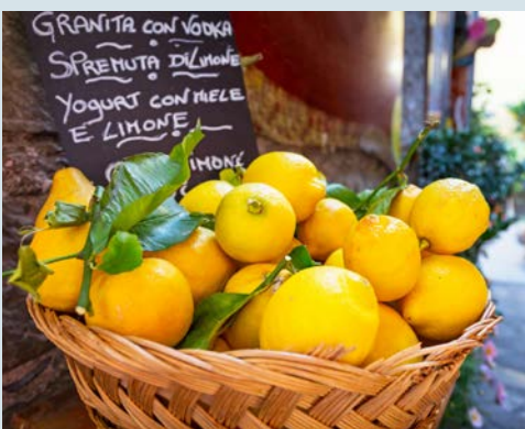
Zitronen gedeihen hier prächtig