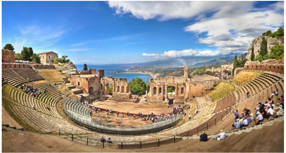
Antikes Theater von Taormina

Bequem, mit nur einem Hotelwechsel, erkunden Sie während der Standortrundreise die Insel.