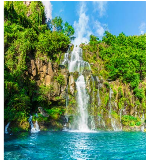
La Reunion – Basins of Aigrettes

Nach der Ausschiffung empfängt Sie Ihr deutschsprachiger Reiseleiter am Hafen von Port Louis zu einer ganztägigen Tour in einem klimatisierten Reisebus. Zunächst fahren Sie in die bezaubernde Stadt Mahébourg. Die einzigartige Mischung aus historischen Gebäuden, Denkmälern und authentischen kreolischen Häusern verleihen der Altstadt ein folkloristisches Ambiente. Folgen Sie Ihrem Reiseleiter zu einem Besuch des Marinemuseums, in dem viele Relikte der historischen Seeschlacht zwischen