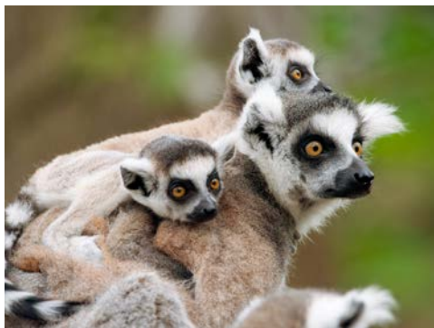
Lemuren auf Madagaskar

Lassen Sie sich an Bord in der Weinbar der Michael-Mondavi-Familie mit wohlschmeckenden Weinen verwöhnen. Spielen Sie Ihre Glückssträhne im Casino aus, oder besuchen Sie die O'Sheehan's Neighborhood Bar & Grill.