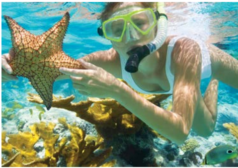
Das Karibische Meer lädt zum Schnorcheln ein