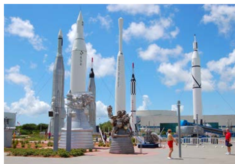
Kennedy Space Center

Heute endet Ihre erlebnisreiche Kreuzfahrt mit der Norwegian Prima. Nach der Ausschiffung unternehmen Sie auf dem Weg zum Flughafen aber