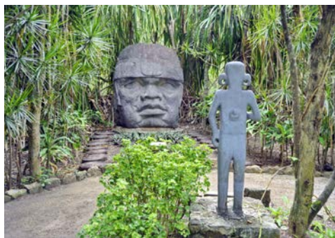
Maya-Kult auf Cozumel

die fantastischen Angel-, Schnorchel- und Tauchmöglichkeiten bekannt. Dem wachsenden Tourismus der letzten Jahre zum Trotz, haben sich die Insel und ihre einzige Stadt, San Miguel, ihren ursprünglichen Charme weitestgehend bewahrt. Zusätzlich können Sie hier Einblicke in die faszinierende Geschichte der Maya erhalten. Auf der Insel wurden mehr als 30 kleinere Maya-Stätten gefunden, aber nur wenige sind erforscht oder gar restauriert. Am bedeutendsten ist wohl die Ruinenstätte San Gervasio.