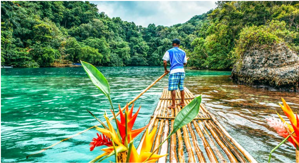
Vielleicht unternehmen Sie eine Bambus-Floßfahrt auf Jamaika