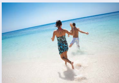
Traumstrände erwarten Sie