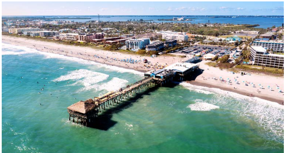
Cocoa Beach zwischen dem Indian River und dem Atlantik

Wenn Ihr Blick aus dem heimischen Fenster nur noch Grau für Sie bereithält, ist es an der Zeit, den Koffer zu packen. Auftakt ist der Sunshine State Florida, Cocoa Beach. Freuen Sie sich auf drei Nächte im fantastisch gelegenen Four Points by Sheraton Cocoa Beach, unweit des malerischen Atlantiks. Palmen, Sonne satt, das rauschende Meer ... was will man mehr? Vielleicht noch ein wenig Sightseeing in der Karibik? Die innovative und erstklassig ausgestattete Norwegian Prima führt Sie auf die Privatinsel der Norwegian Cruise Line: Great Stirrup Cay auf den Bahamas! Rhythmisch wiegende Palmen und sanftes Meeresrauschen geleiten Sie weiter nach Jamaika und zu den Grand Cayman. Auf Cozumel können Sie noch in die faszinierende Geschichte der Maya eintauchen, bevor Ihre Kreuzfahrt zurück in Port Canaveral endet. Sie beschließen Ihre erlebnisreiche Reise mit dem Besuch des Kennedy Space Centers.