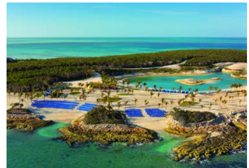
Die Privatinsel Great Stirrup Cay

Nach Ihrem Frühstück im Hotel erfolgen der Transfer zum Hafen Port Canaveral und die Einschiffung auf die Norwegian Prima. Am frühen Abend heißt es „Leinen los“, Kurs Bahamas!