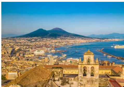
Blick auf Neapel mit dem Vesuv

Nach dem Frühstück heißt es Abschied nehmen: Fahrt zum Flughafen und Rückflug zum gebuchten Flughafen.