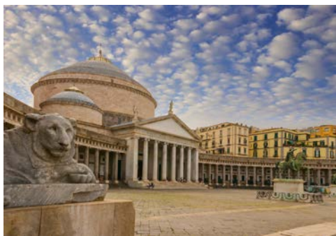
Der große Platz in Neapel mit Kathedrale

Sie haben die Möglichkeit, mit dem hoteleigenen Shuttle-Bus nach Sorrent zu fahren, zu bummeln und ein paar Mitbringsel zu erstehen.