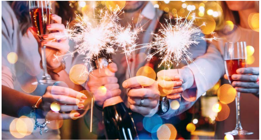
Ein frohes neues Jahr 2025

Silvester in Sorrent zu feiern ist ein unvergessliches Erlebnis. Genießen Sie den Blick auf ein spektakuläres Feuerwerk um Mitternacht im Golf von Neapel nach einem traditionellen Silvestermenü mit Linsen, Symbol von Reichtum und Glücksbringer für das kommende Jahr. Auf dieser Reise erkunden Sie Neapel, die imposanten Ausgrabungen von Pompeji und Herculaneum. Eine Fahrt entlang der kurvenreichen Amalfitana ist ein Muss bei einer Reise in die Region „Campania Felix“ – das glückliche Kampanien. Schon mal „Gnocchi alla Sorrentina“ probiert? Bei einem Kochkurs wird Ihnen die Zubereitung dieses beliebten Gerichtes demonstriert und bei einem Besuch eines Weingutes am Fuße des Vesuvs verköstigen Sie den lokalen Wein „Lacryma Christi“