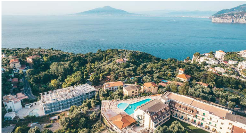
Das GRAND HOTEL VESUVIO in Sorrent

(bestehend aus 4 Ausflügen: Entlang der Amalfi- küste; Ganztagesausflug Pompeji mit Mittagessen & Weinverkostung; Halbtagesausflug Herculaneum; Tagesausflug Neapel mit Pizza-Essen) mit Deutsch sprechender Reiseleitung; MTZ: 20 Personen)