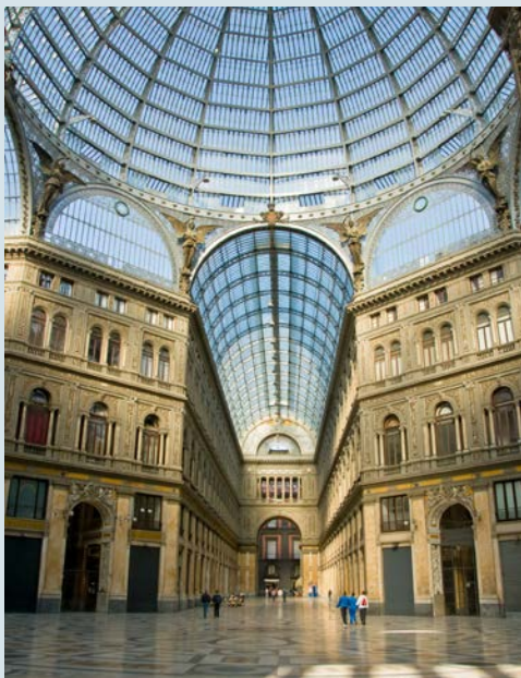
Passage Galleria Umberto I in Neapel