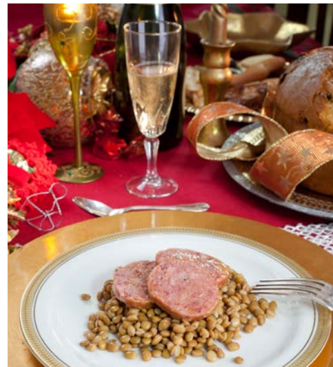
Traditionell zu Silvester: Linsengericht & Spumante