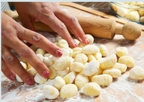
Freuen Sie sich auf frisch zubereitete Gnocchi

Im Rahmen des Ausflugspaketes besuchen Sie heute Vormittag Herculaneum. Genauso wie Pompeji wurde Herculaneum durch den Ausbruch des Vesuvs komplett verschüttet. Sie spazieren auf den originalen römischen Straßen und begutachten dabei die Inneneinrichtungen der Häuser, darunter Wandmalereien, Ladeneinrichtungen, Mosaikfußböden und Wasserleitungen. Im Jahr 79 lebten hier ca. 4000 Einwohner