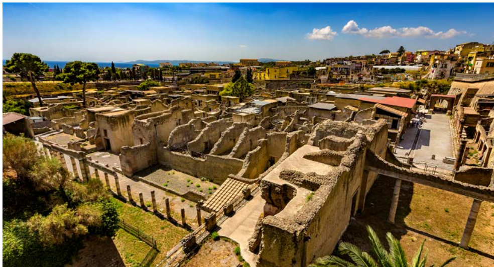
Antike Stätten von Herculaneum

– darunter viele reiche Römer, die ihre Sommerresidenz in die kleine Hafenstadt verlegten. Im Gegensatz zu Pompeji blieb den meisten Bewohnern Herculaneums anscheinend noch Zeit für die Flucht vor dem Vulkanausbruch. Lediglich am Ufer in einem Bootshaus wurden ca. 250 Skelette gefunden, bei denen es sich wohl um Alte und Kranke handelte, die nicht mehr fliehen konnten. Durch die anrollende Hitzewelle wurde jegliches Leben sofort vernichtet und Herculaneum wurde von einer 20 m hohen vulkanischen Schicht bedeckt, die wie eine perfekte Konservierung wirkte. Rückkehr zum Hotel. Am Abend werden Sie zum Galadinner im Hotel erwartet mit Livemusik, Möglichkeit zum Tanz und Feuerwerk um Mitternacht.