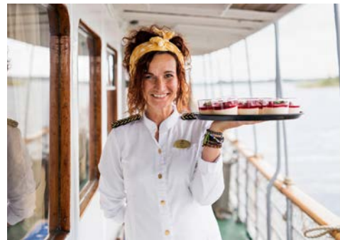
Willkommen an Bord

Mit der grünen Kogge kennzeichnen wir Reisen, die in besonderer Weise nachhaltig sind. Dabei greifen wir u.a. auf besonders klimafreundliche Transportmittel zurück oder bieten eine entsprechende CO 2 Kompensation an.