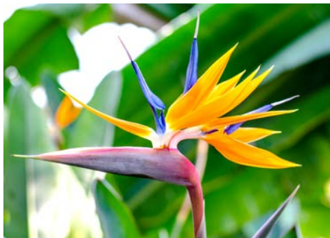
Strelitzien und Hortensien finden Sie hier überall

Im Anschluss geht es in das kleine Städtchen Ribeira Grande. Um die zentrale Brücke findet man einen kleinen Park und drum herum gesellen sich Cafés. Auf dem Programm stehen der Besuch einer traditionellen Keramikfabrik sowie des Museums Casa da Cultura.