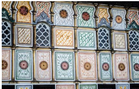
Die „Bunte Moschee“ macht ihrem Namen alle Ehre

Nach dem Frühstück im Hotel geht es in die Altstadt der nordmazedonischen Hauptstadt Skopje, in der die Highlights wie die Festung Kale, der große Bazar und die Neustadt besichtigt werden. Nach einem traditionellen Mittagessen in einem lokalen Restaurant reisen Sie zum Matka-Tal. In diesem Canyon kann man einige Höhlen und eine Vielzahl an Pflanzen und Tieren entdecken. Nach der Besichtigung Rückfahrt zum Hotel. Abendessen und Übernachtung im Hotel.