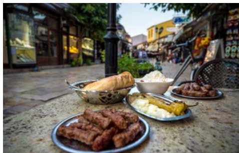
Die Küche ist eher deftig

7. Tag: Rückfahrt nach Skopje mit Zwischenhalt in Bitola und der „nordmazedonischen Toskana“ inkl. Weinprobe und traditionellem Abendessen mit Musik Frühstück im Hotel. Auf dem Weg zurück nach Skopje gibt es einen Zwischenstopp in der Stadt Bitola, in osmanischer Zeit auch die Stadt der Diplomaten genannt. Zahlreiche alte Botschaftsgebäude zeugen von dieser Vergangenheit. In Bitola ist auch Kemal Atatürk zur Schule gegangen. Weiter geht es in die „nordmazedonische Toskana“, wo Sie eine Verkostung der ausgezeichneten Weine erwartet. Bezug des Hotels in Skopje. Zum Abschluss der Reise erwartet Sie ein traditionelles Abendessen mit Musik. Abendessen und Übernachtung im Hotel.