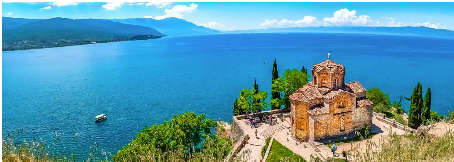
Tolle Aussichten am Ohridsee