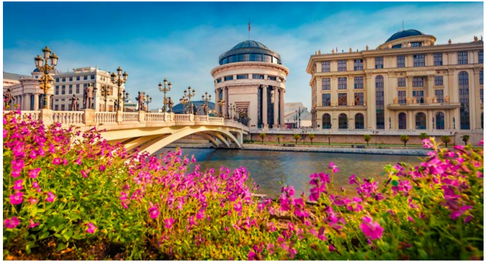
Wahrzeichen der Stadt Skopje ist die Steinbrücke aus dem 15. Jahrhundert

Auf der Balkanhalbinsel, zwischen Albanien und Bulgarien gelegen, liegt ein Land, das noch zu den echten Geheimtipps in Europa zählt und mit seinem ursprünglichen Charme lockt: Nordmazedonien! Eine Reise dorthin lohnt sich aus vielen Gründen: Die Landschaft ist vielfältig, mit majestätischen Bergen, klaren Seen und grünen Tälern. Historische Stätten, beeindruckende Klöster und zauberhafte Altstädte erzählen spannende Geschichten von Römern, Byzantinern und Osmanen. Die Gastfreundschaft ist herzlich und die Küche abwechslungsreich. Sie wohnen zunächst in der Hauptstadt Skopje und wechseln dann nach Ohrid am gleichnamigen See. Freuen Sie sich auf ein Land zwischen Tradition und Moderne – und lassen Sie sich rundum begeistern!