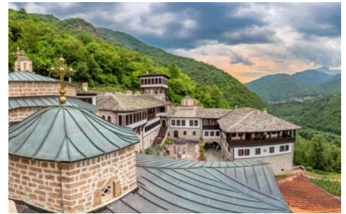
Nationalpark Mavrovo, Kloster Sveti Jovan Bigorski

Frühstück im Hotel. Heute geht die Fahrt nach Tetovo, wo die berühmte „Bunte Moschee“ besucht wird. Im Anschluss geht es in den Nationalpark Mavrovo, wo Sie eine einzigartige Natur und die höchsten Berge Nordmazedoniens erwarten. Sie statten dem Kloster Sv. Jovan Bigorski einen Besuch ab und fahren über Debar weiter zur Stadt Struga. Dort wird Ihr Hotel bezogen. Abendessen und Übernachtung im Hotel.