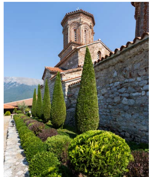
Kloster Sveti Naum am Ohridsee

Frühstück im Hotel. Heute erwartet Sie eine Schiffsfahrt auf dem Ohridsee mit dem Ziel des wohl bekanntesten Fotopunkts Nordmazedoniens, der Kirche Kaneo. Im Anschluss wird die UNESCO-Stadt zu Fuß erkundet. In und um Ohrid befinden sich um die 365 Kirchen und Klöster, weshalb die Stadt den Beinamen „Jerusalem des Balkans“ trägt. Weiter geht die Fahrt zum Kloster Sveti Naum, wo Sie ein gemeinsames Mittagessen bei den Quellen des Ohridsees umgeben von viel Vegetation erwartet. Das Kloster wurde auf einem hohen Felsvorsprung, inmitten eines tiefen