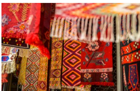
Kunstvoll gewebte Stoffe und Teppiche

Waldes, den See überblickend gebaut. Rückfahrt zum Hotel. Abendessen und Übernachtung im Hotel.